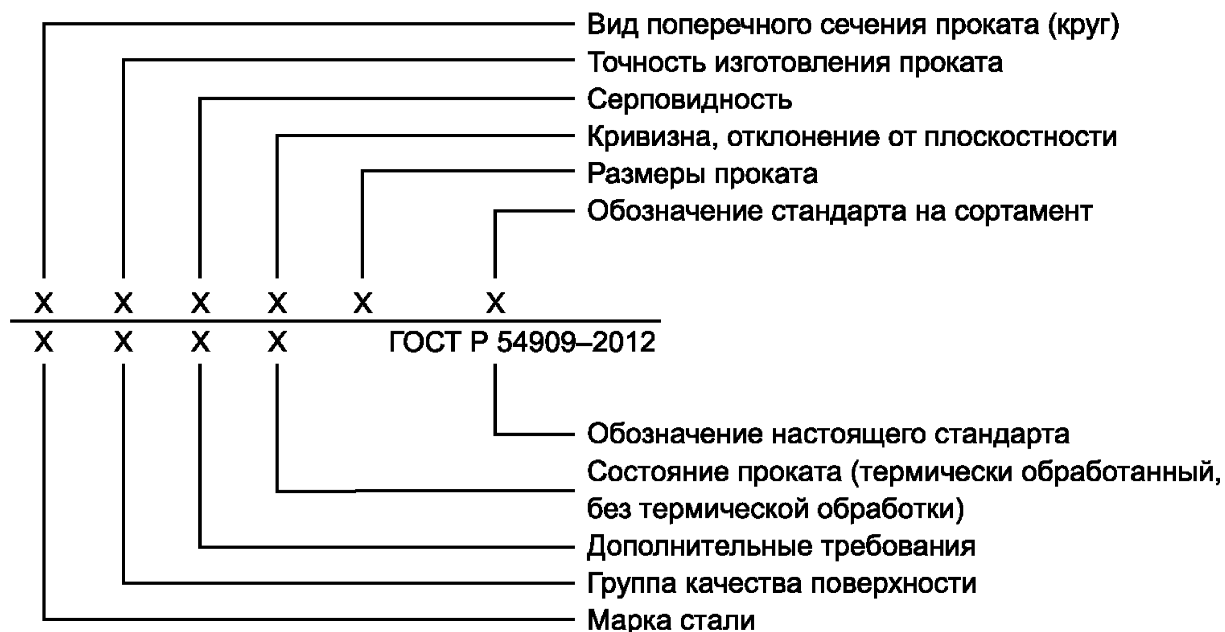
Схема условных обозначений длинномерной и плоской металлопродукции из клапанной стали

Пример условного обозначения прутка горячекатаного круглого, обычной точности прокатки (N), допуска на длину класса (O), обычной кривизны (A), диаметром 40 мм по стандарту [6], из стали марки X 45 CrSi 9 3, группы качества поверхности 3, термически обработанного (TO) по ГОСТ Р 54909—2012: