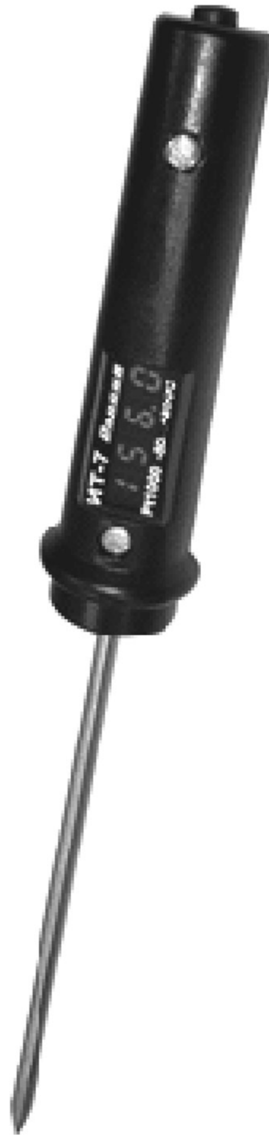
Рисунок Б.1 — Цифровой переносной термометр-щуп ИТ-7

Б.1 Цифровой переносной термометр-щуп приведен на рисунке Б.1.