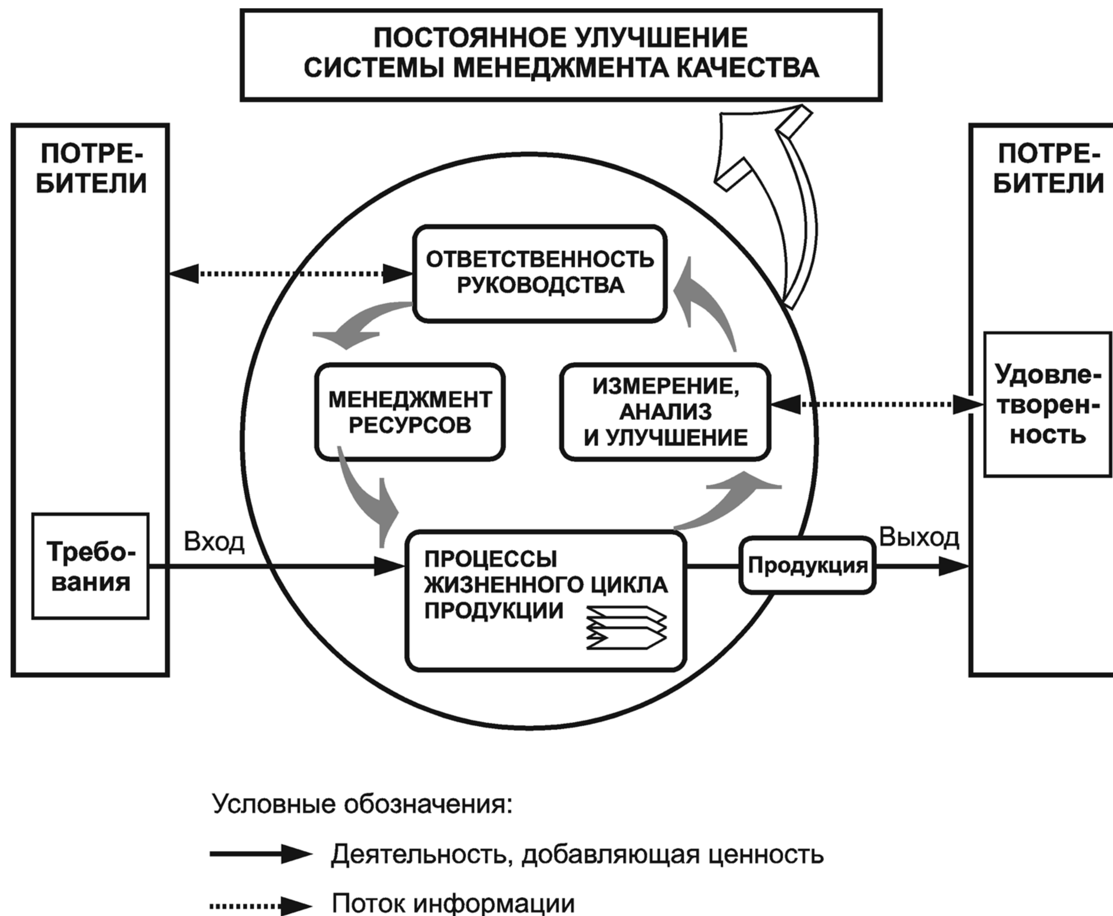
Рисунок 1 — Модель системы менеджмента качества, основанной на процессном подходе

и управляемыми документами (в соответствии с требованиями пункта 4.2.3 «Управление документацией»). Они могут быть представлены на бумаге или на компьютере. В последнем случае пользователь может связать квадраты деятельности с соответствующей процедурой или инструкцией по эксплуатации для обеспечения оперативного и легкого доступа (см. рисунок 1).