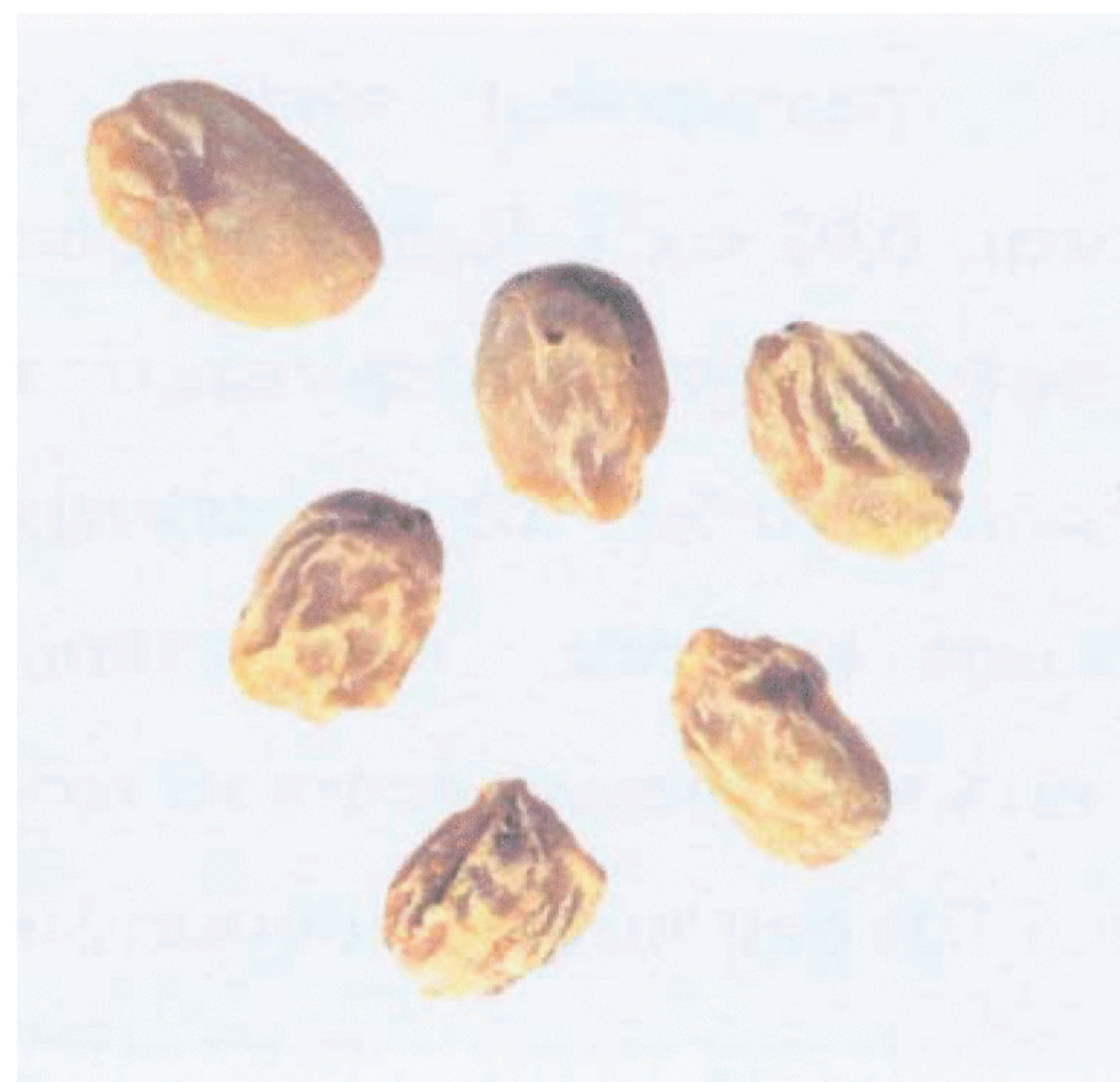
Рисунок С.18 — Сморщенное зерно (см. 4.8)