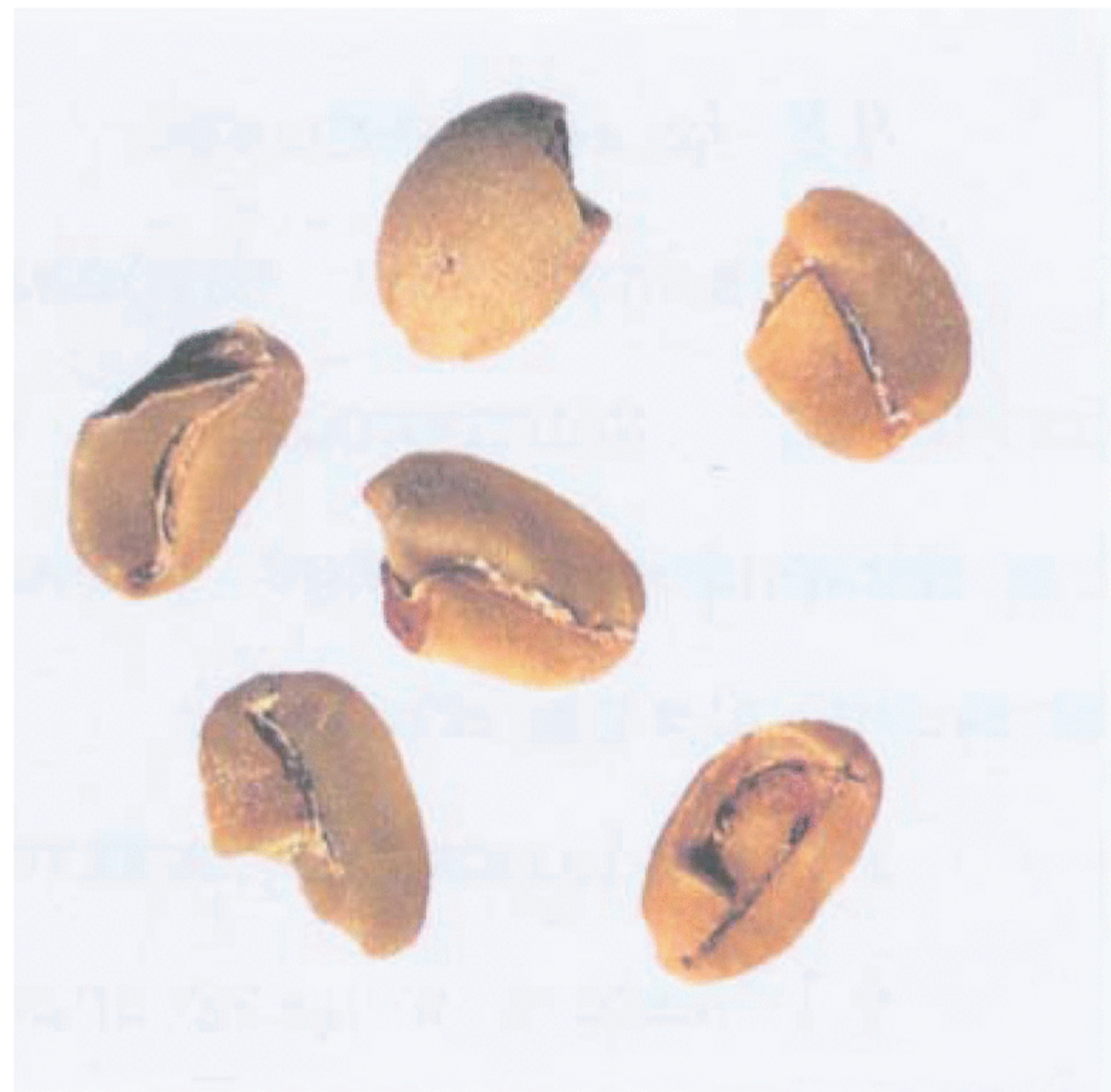
Рисунок С.8 — Ломаное зерно (см. 3.3)