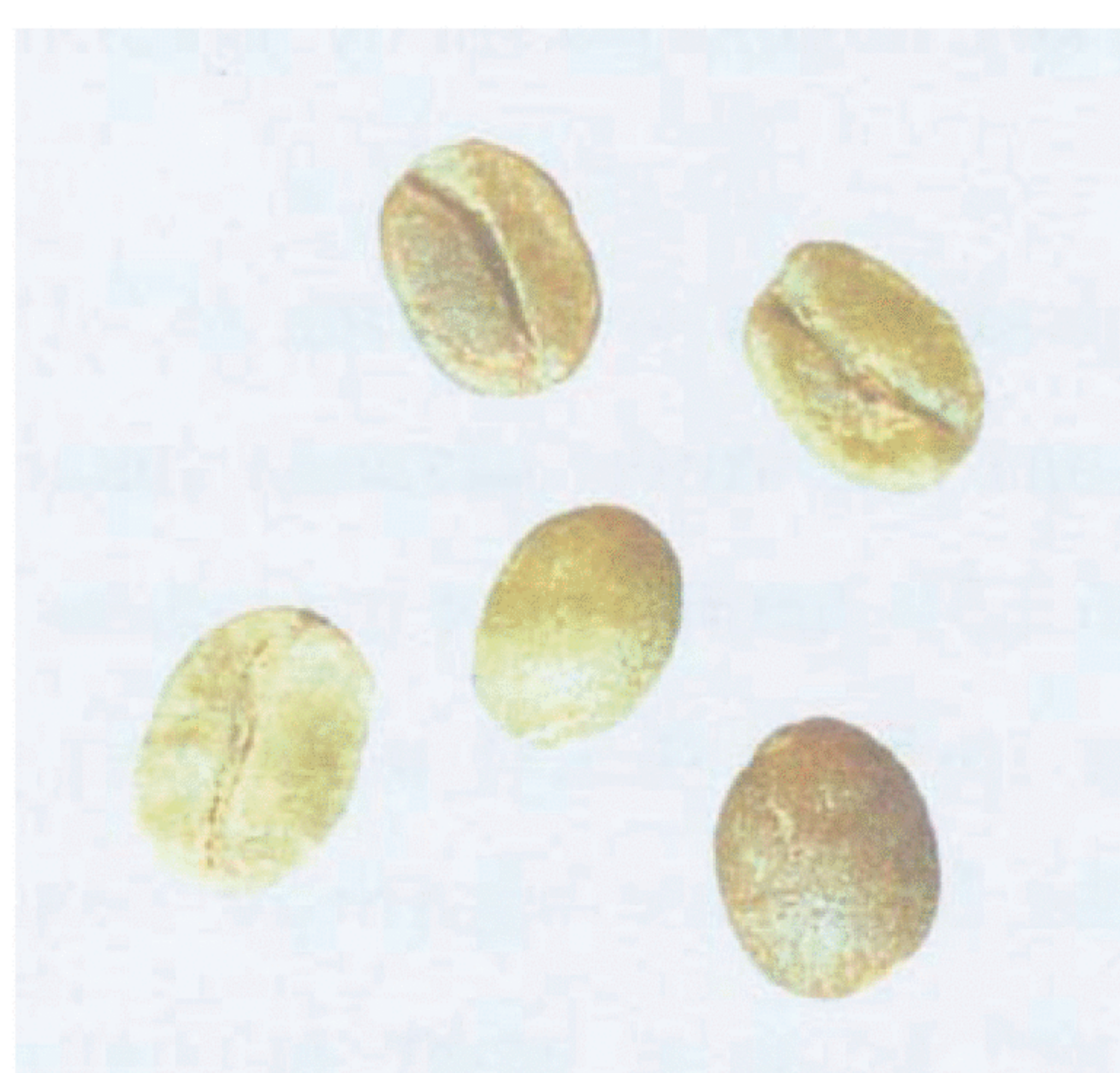
Рисунок С.15 — Незрелое зерно; неразвившееся зерно («quaker») (см. 4.5)