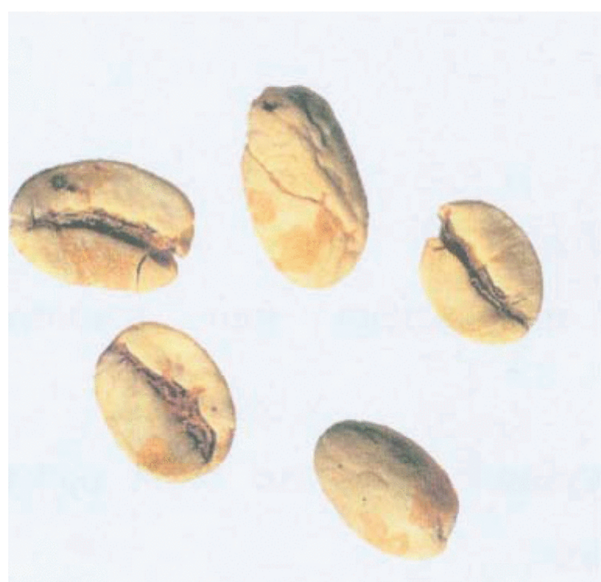
Рисунок С.19 — Губчатое зерно (см. 4.9)