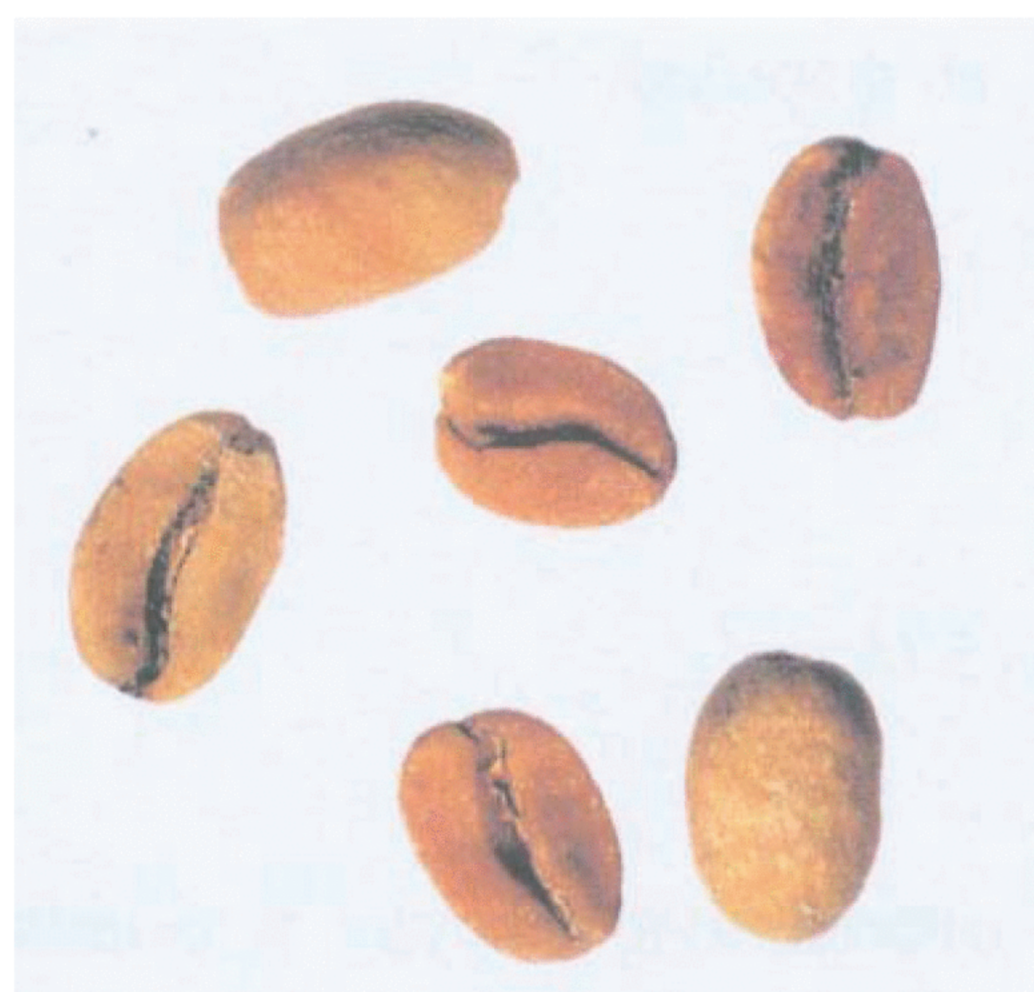
Рисунок С.13 — Коричневое зерно («ardido») (см. 4.3)