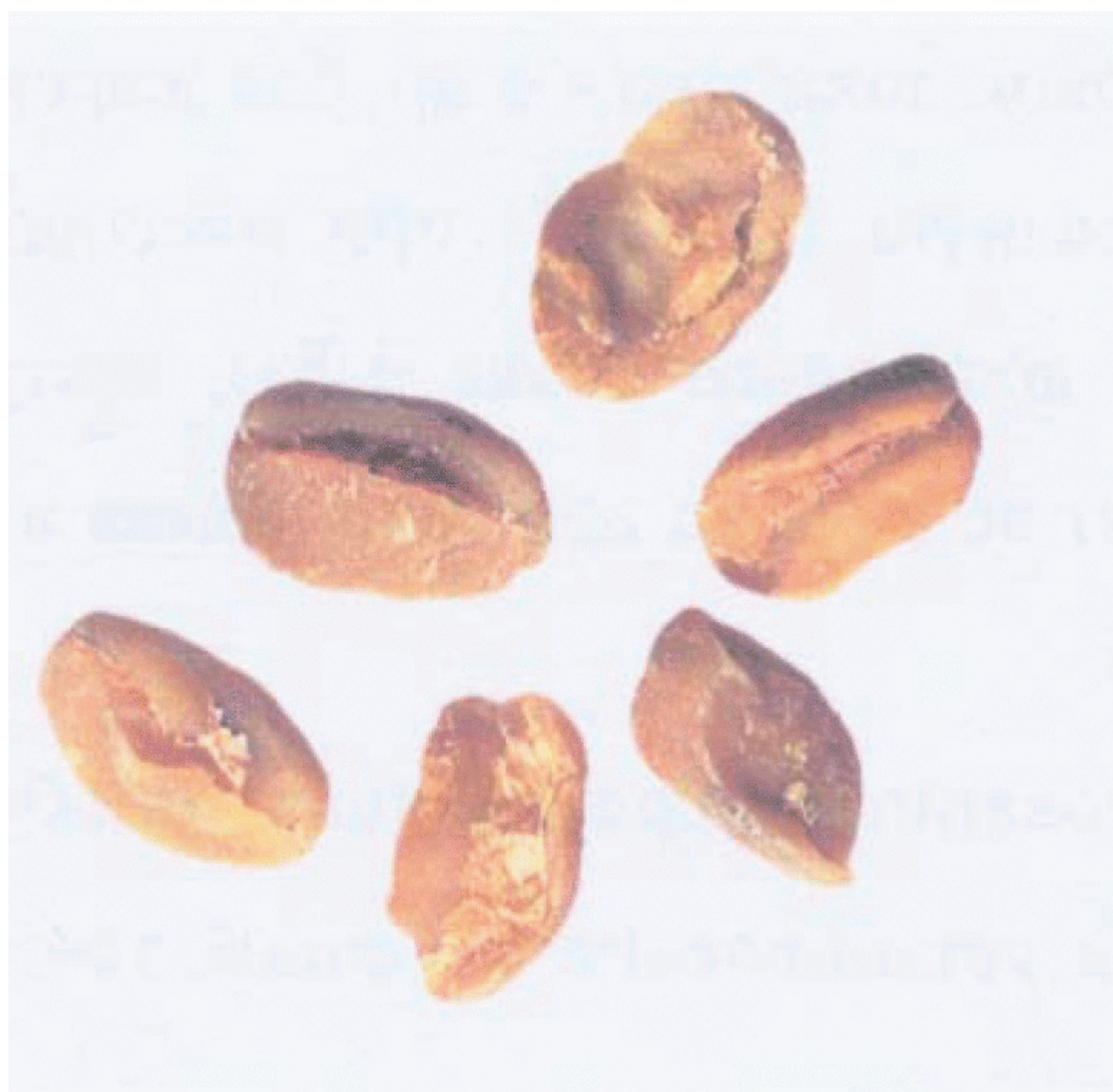
Рисунок С.5 — Зерно неправильной формы: вмятины (см. 3.1)