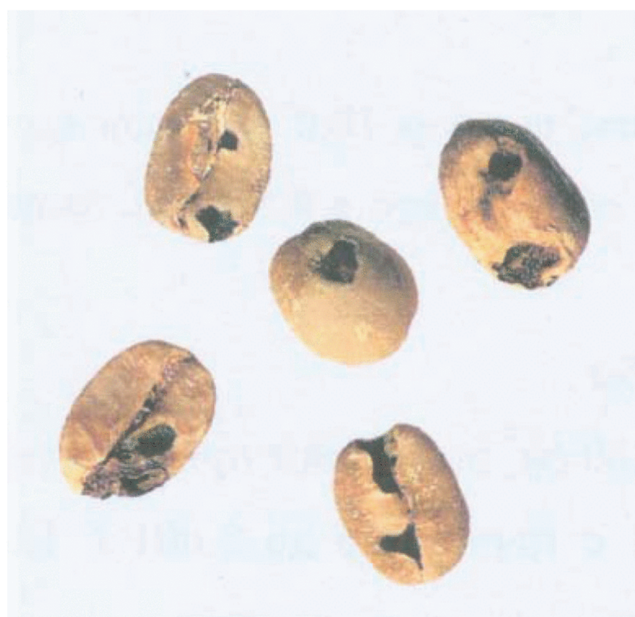
Рисунок С.9 — Зерно, поврежденное насекомыми (см. 3.4)