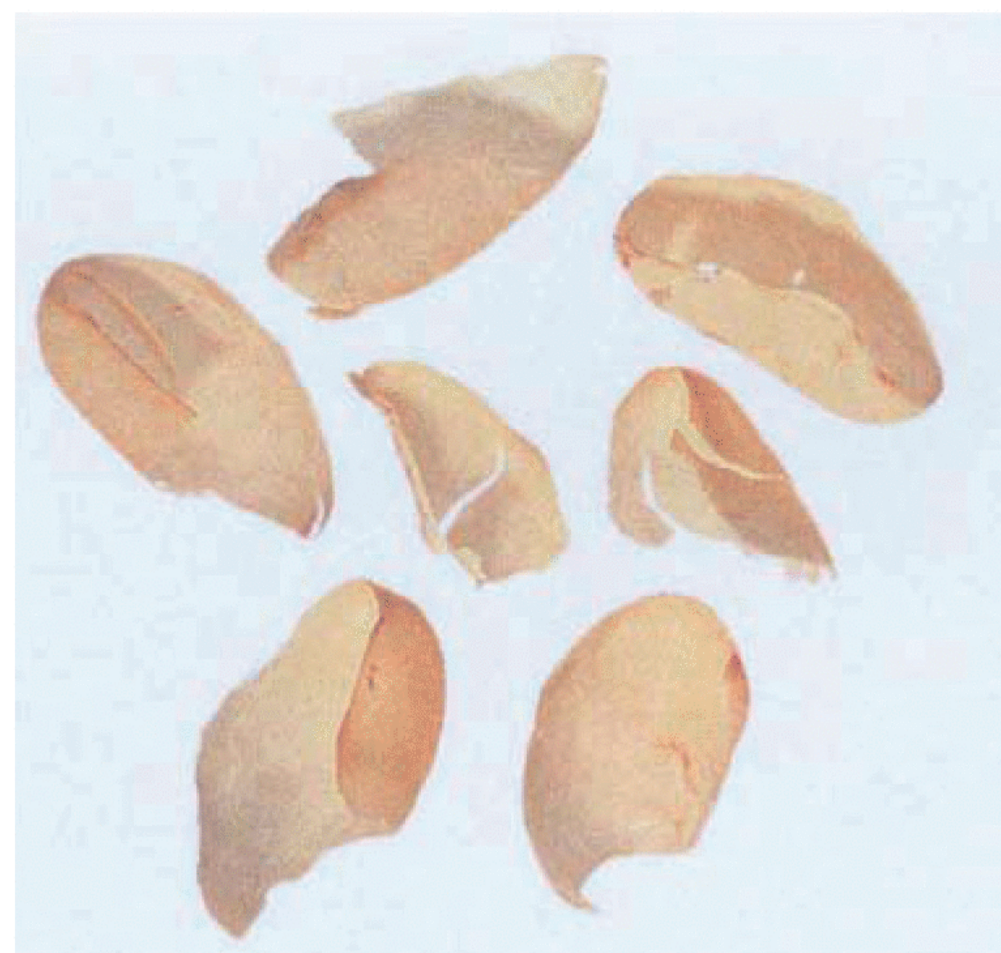
Рисунок С.2 — Часть пергаментной оболочки (см. 2.2)