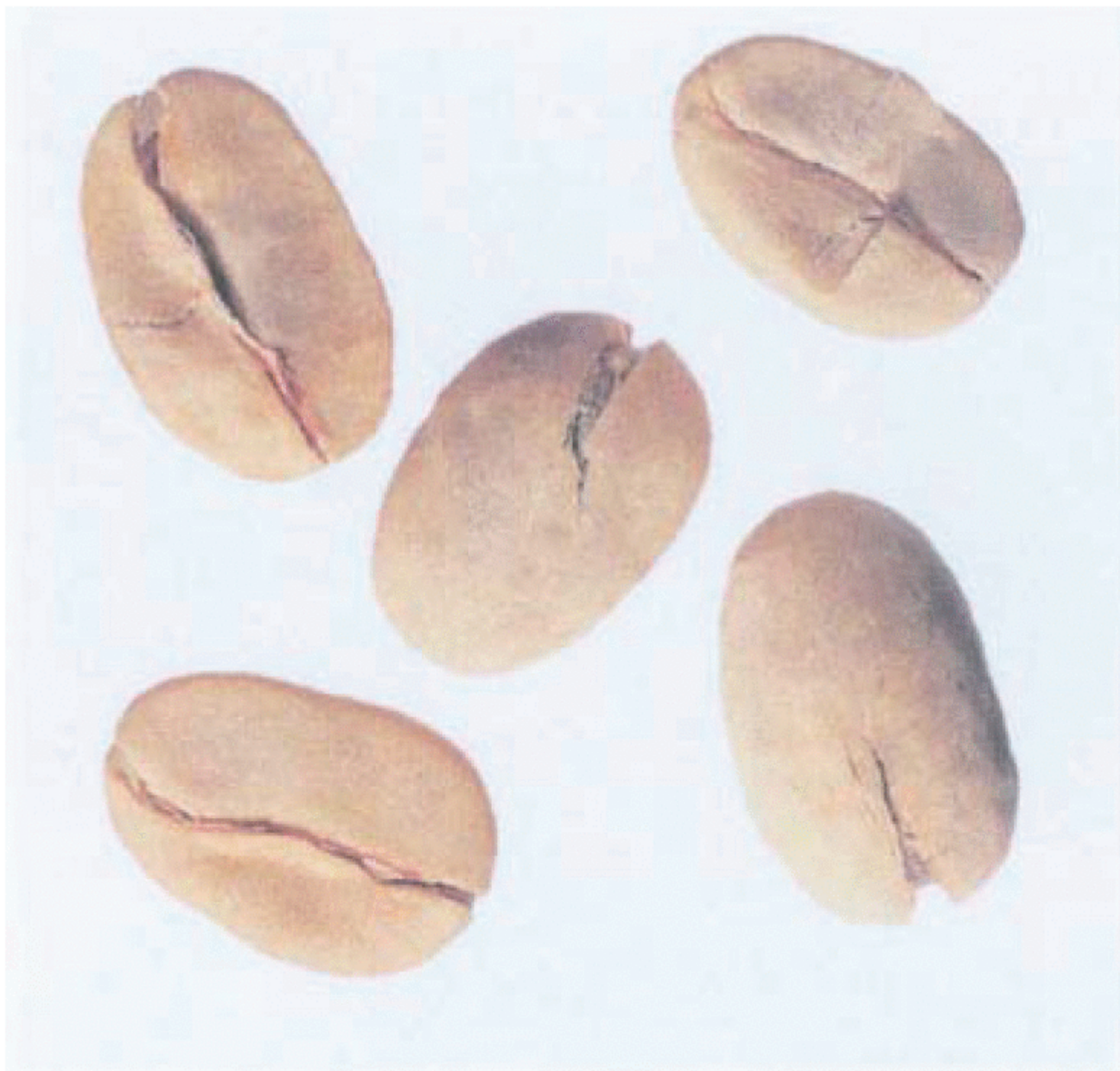
Рисунок С.1 — Зерно в пергаментной оболочке (см. 2.1)