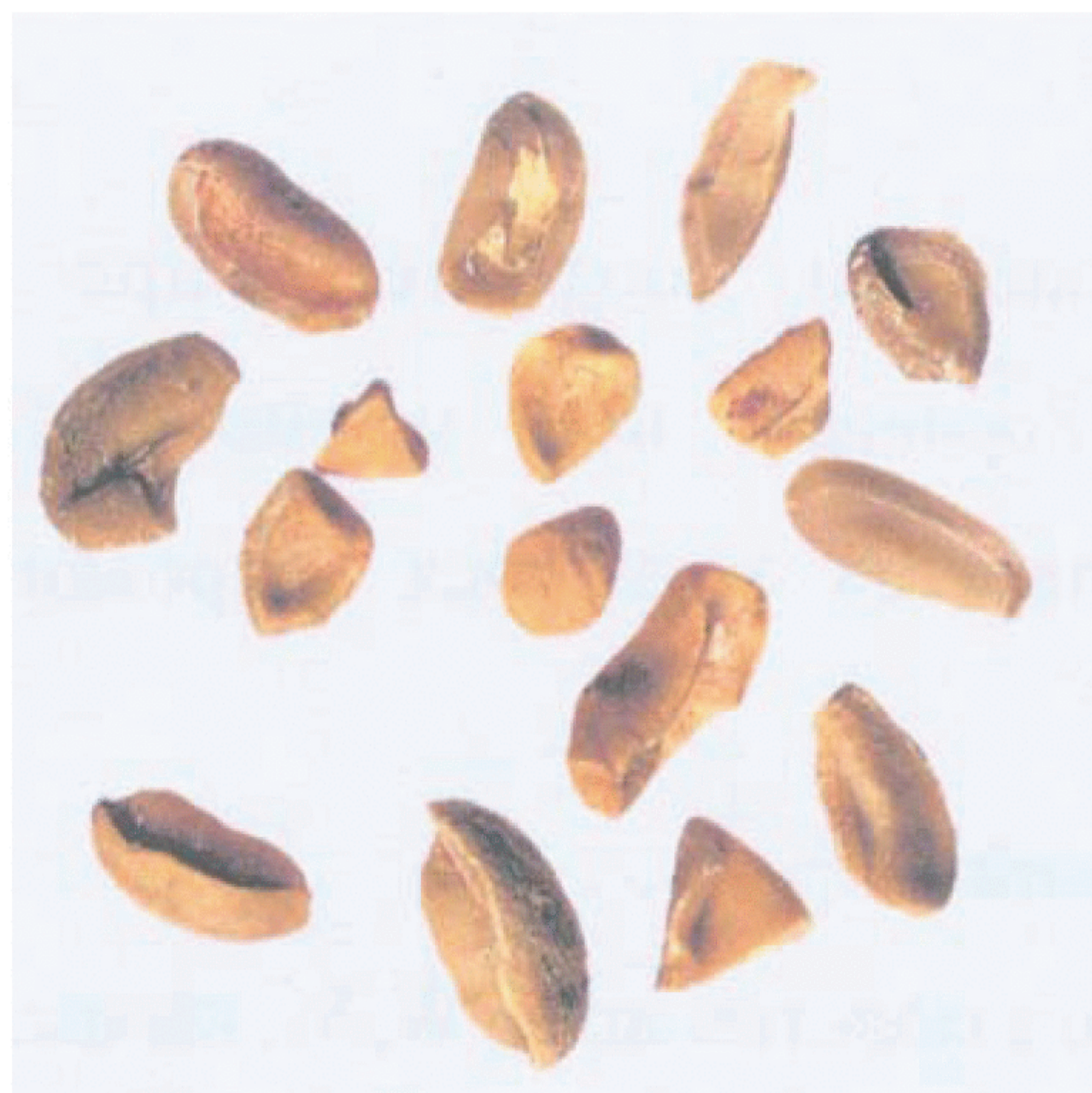
Рисунок С.7 — Обломки зерна (см. 3.2)