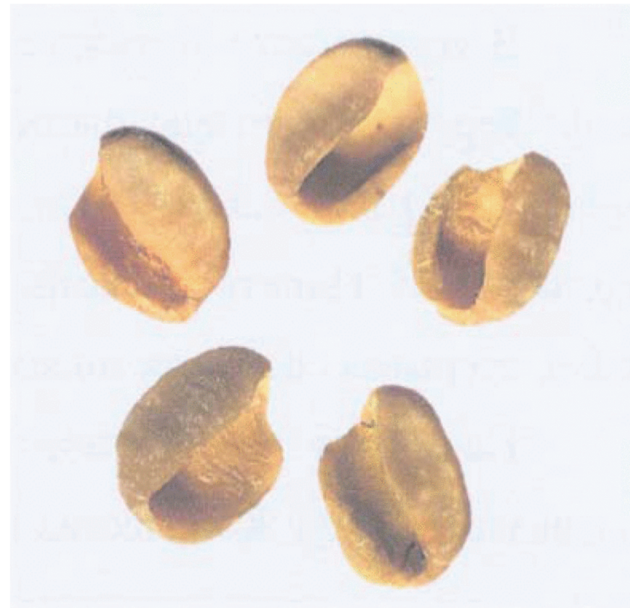
Рисунок С.6 — Зерно неправильной формы: раковины (см. 3.1)