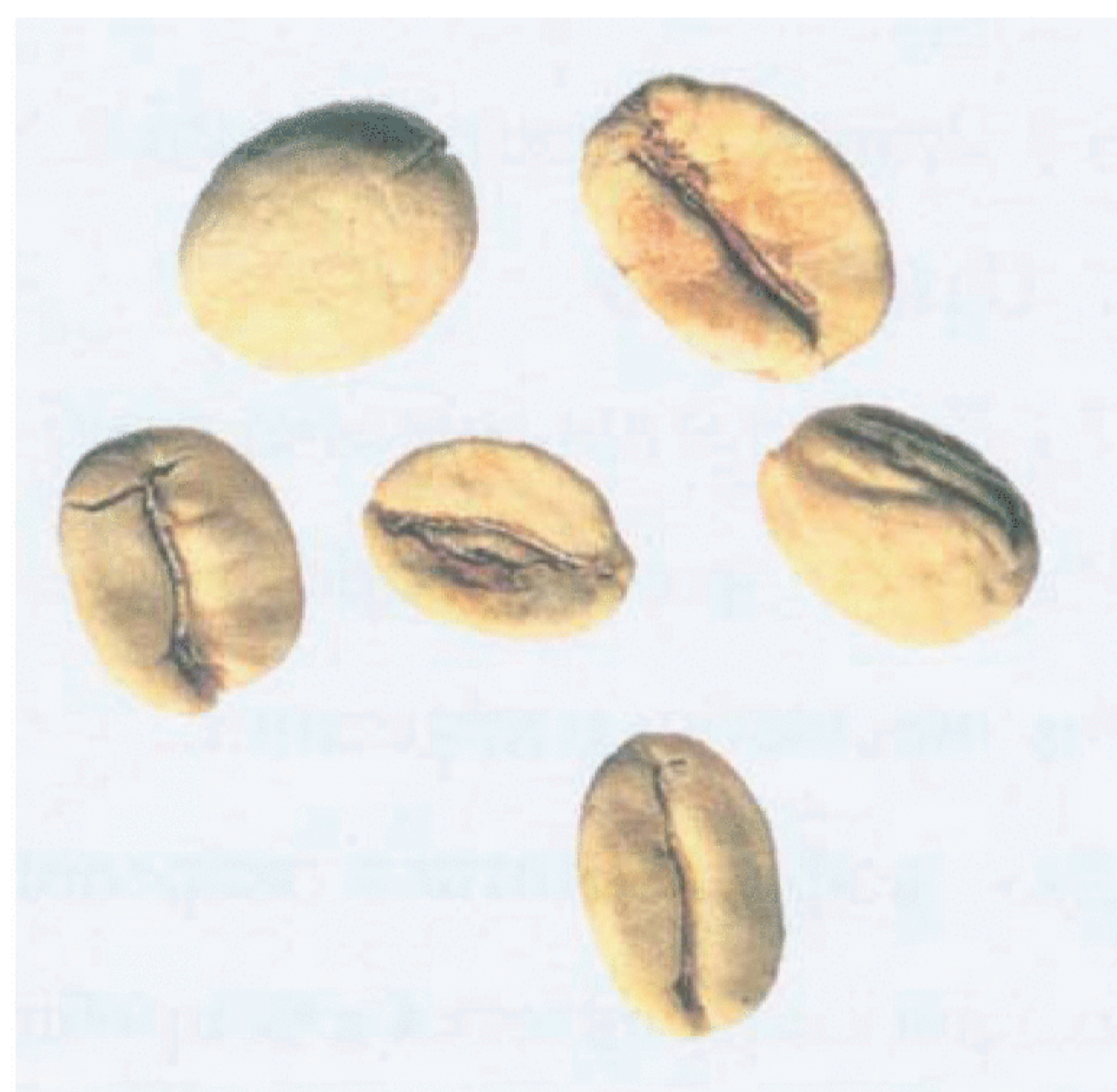
Рисунок С.20 — Белое зерно (см. 4.10)