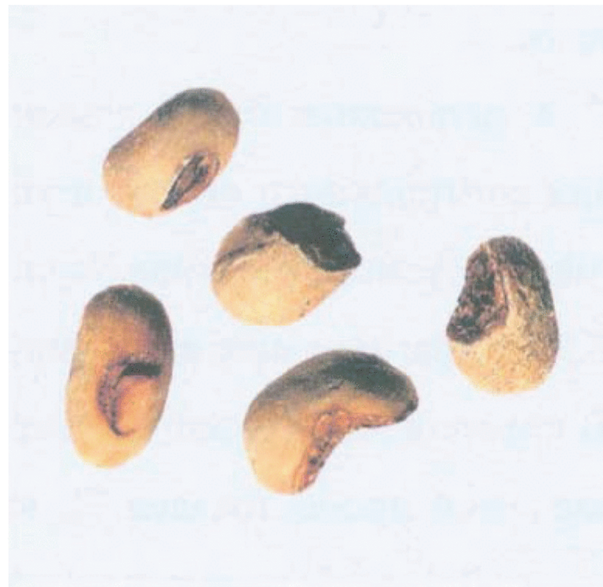
Рисунок С.10 — Зерно, поврежденное при пульпировании (см. 3.6)