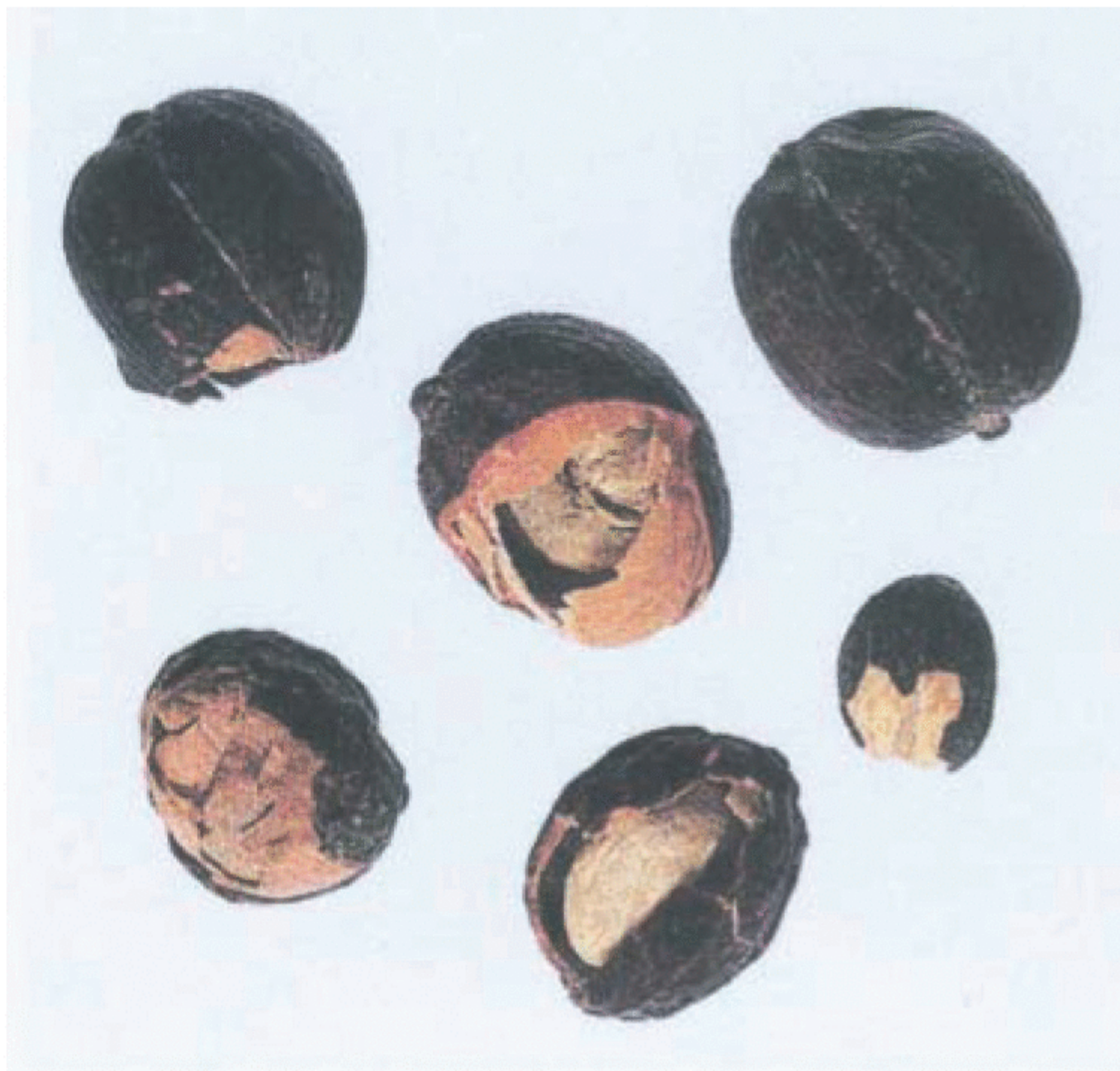
Рисунок С.3 — Сухой кофейный плод (см. 2.3)