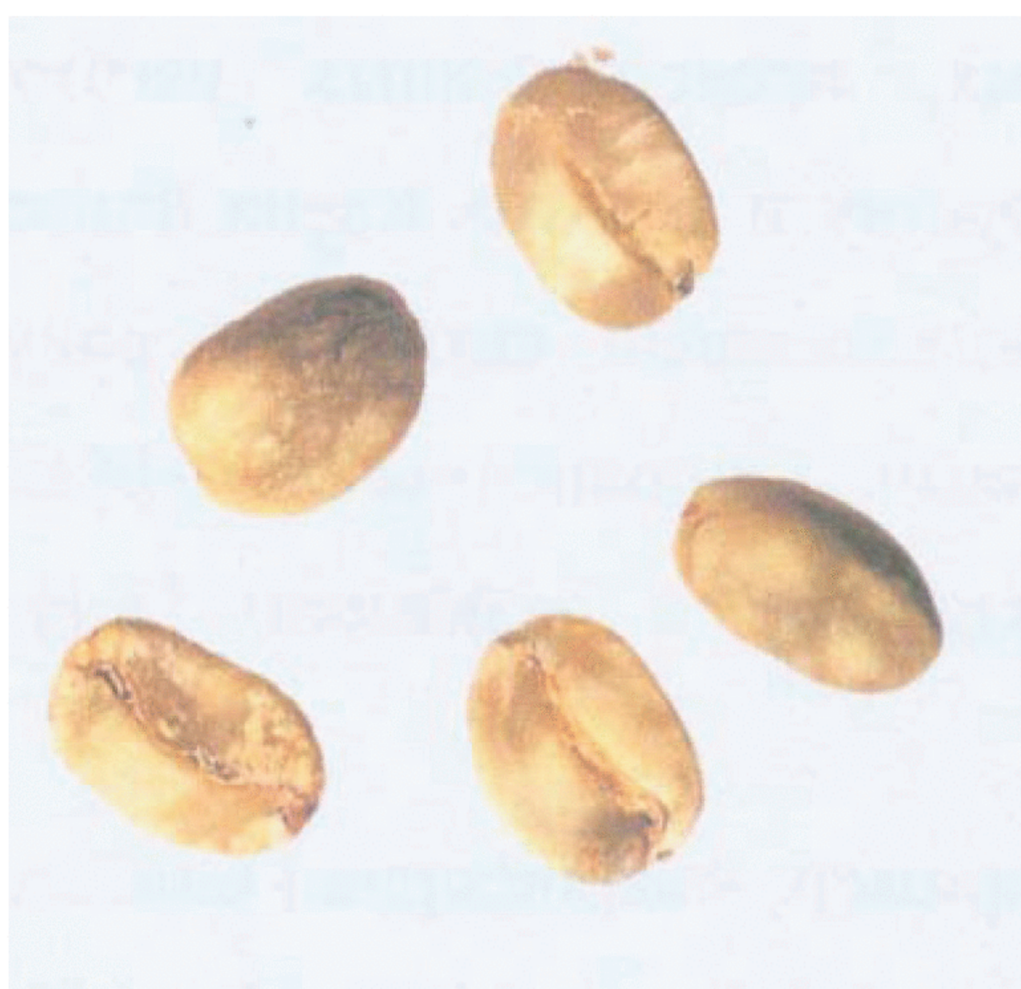
Рисунок С.17 — Пятнистое зерно (см. 4.7)