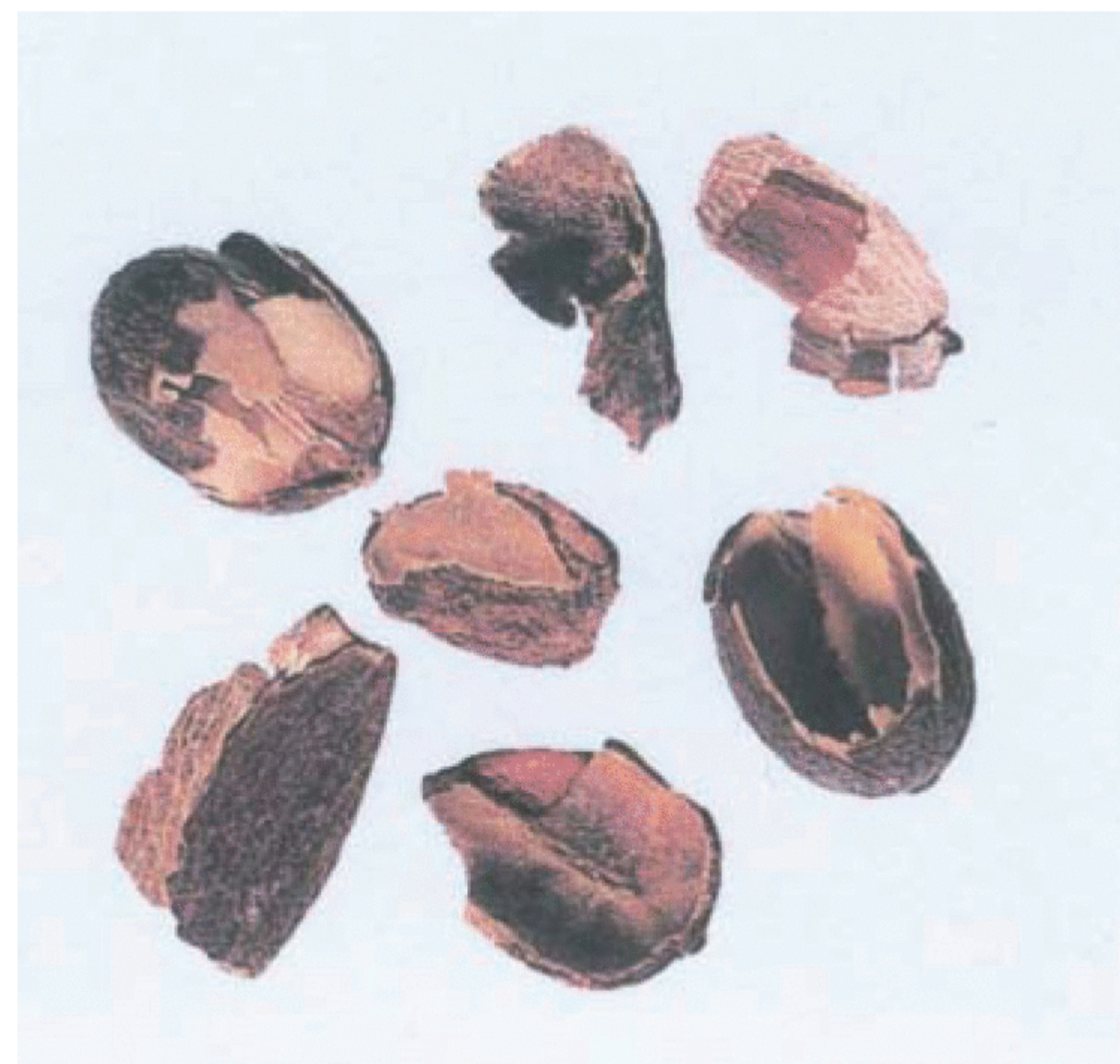
Рисунок С.4 — Часть плодовой оболочки (см. 2.4)