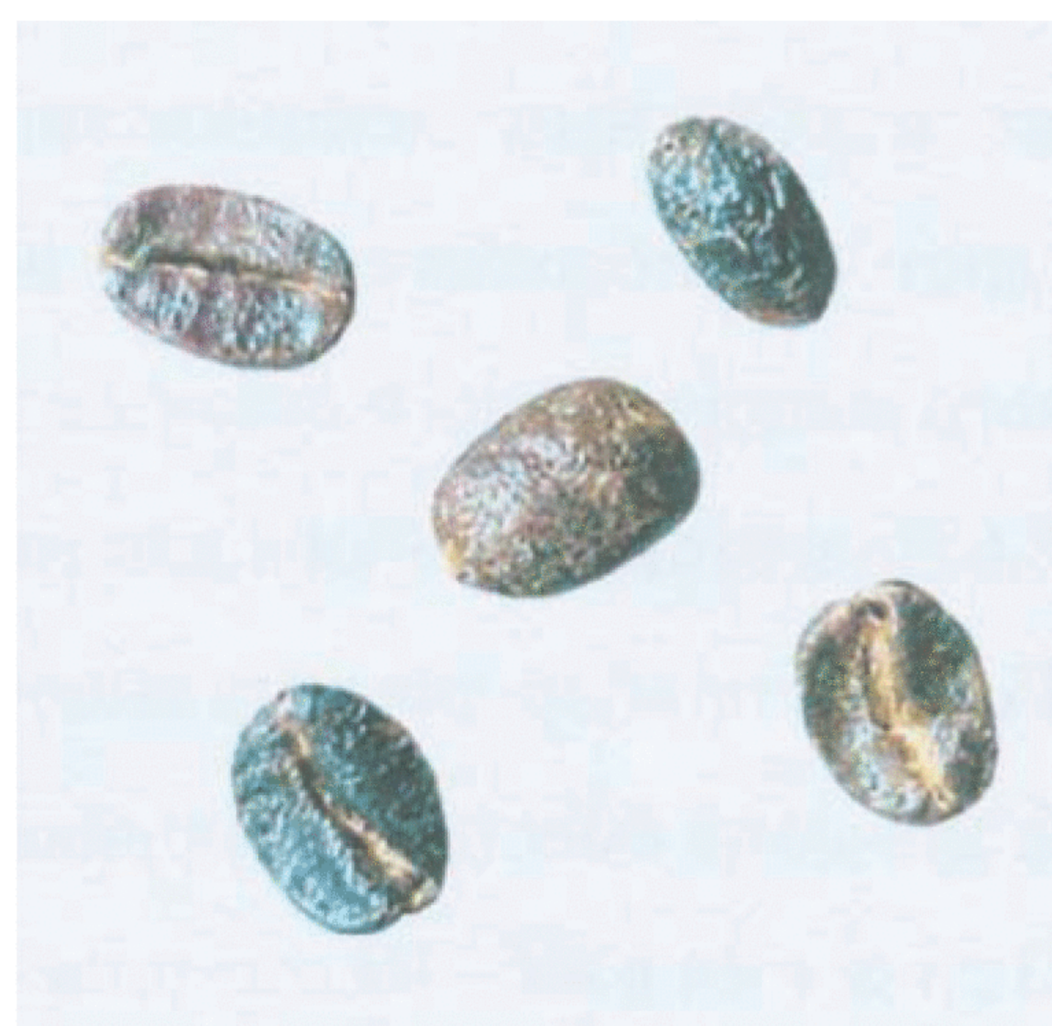
Рисунок С.12 — Черно-зеленое зерно (см. 4.2)