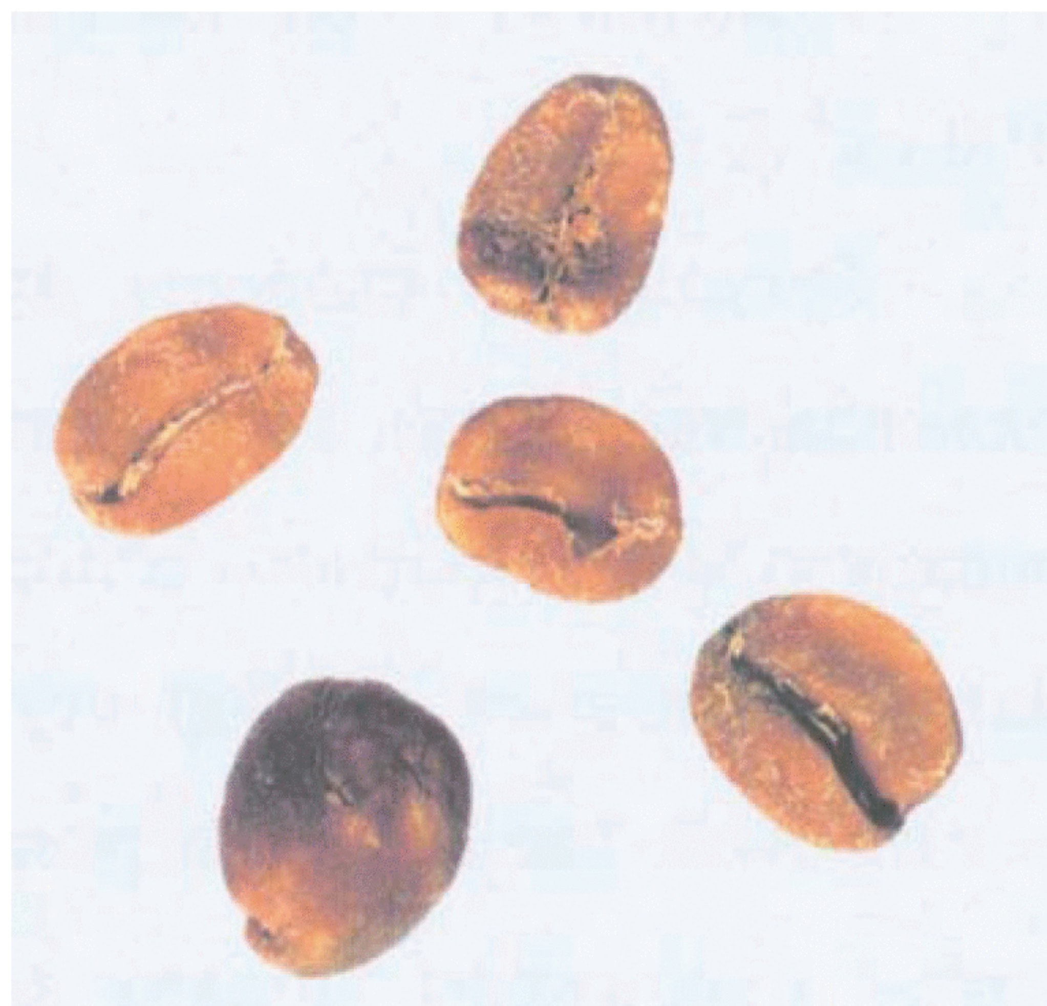
Рисунок С.16 — Восковидное зерно (см. 4.6)