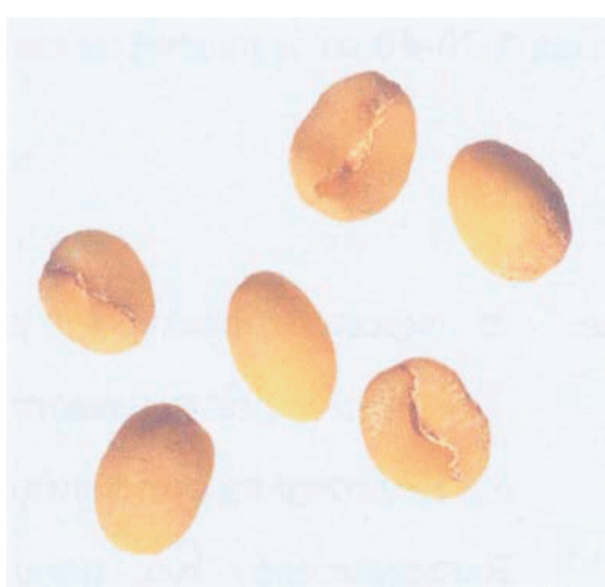
Рисунок С.14 — Янтарное зерно (см. 4.4)