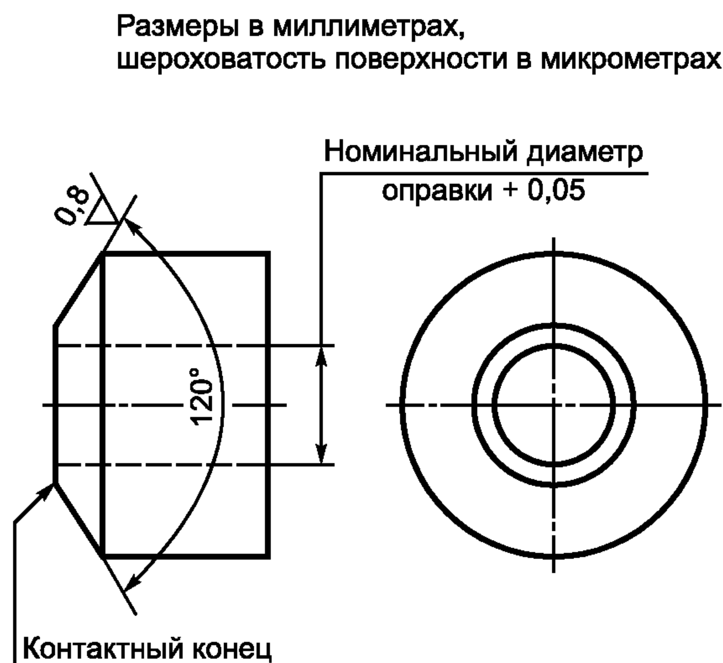
Рисунок 1 — Коническая шайба

4.2 Оправка, закаленная (не менее 45 HRC) и снабженная резьбой с полем допуска 6g , за исключением допуска наружного диаметра, располагающегося в последней четверти диапазона 6g со стороны минимума материала.