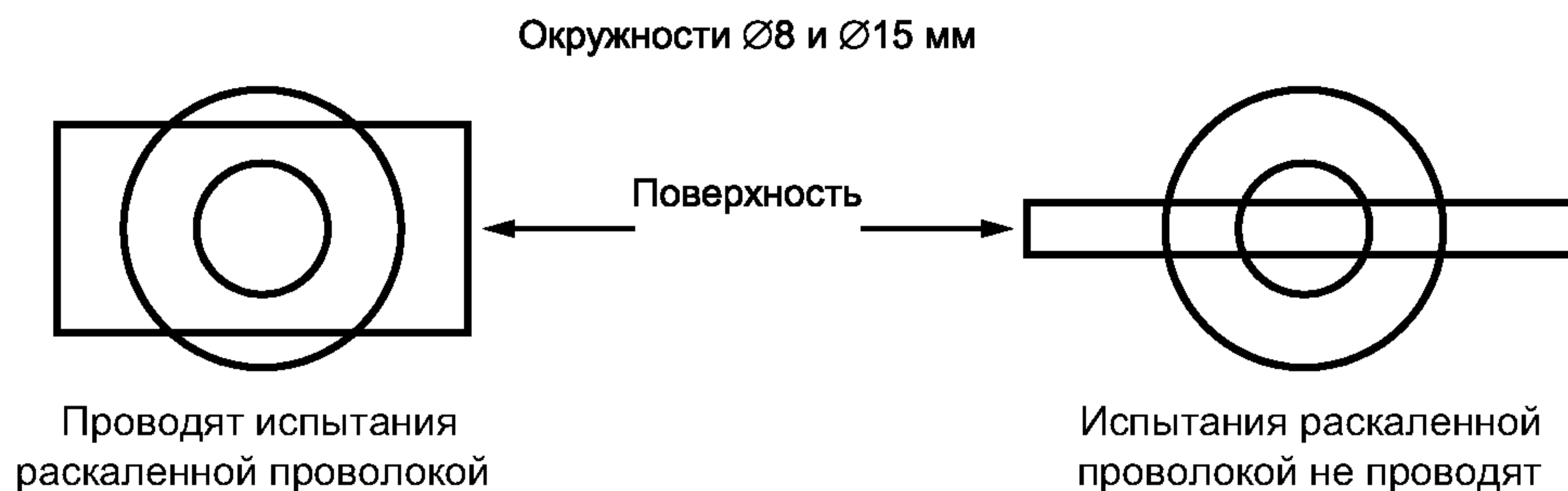
Рисунок 1 — Пример определения мелких деталей