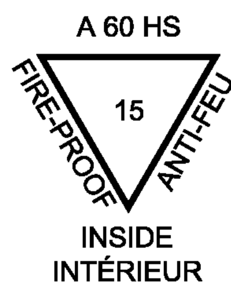
Рисунок 2 — Пример маркировки

Пример маркировки прозрачного термически закаленного безопасного стекла с основным стеклом толщиной 15 мм, имеющего тип огнестойкости «А-60», приведен на рисунке 2.