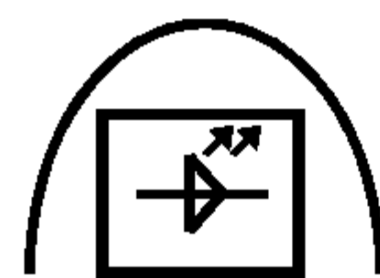
Рисунок 1 — Символ для встраиваемых модулей