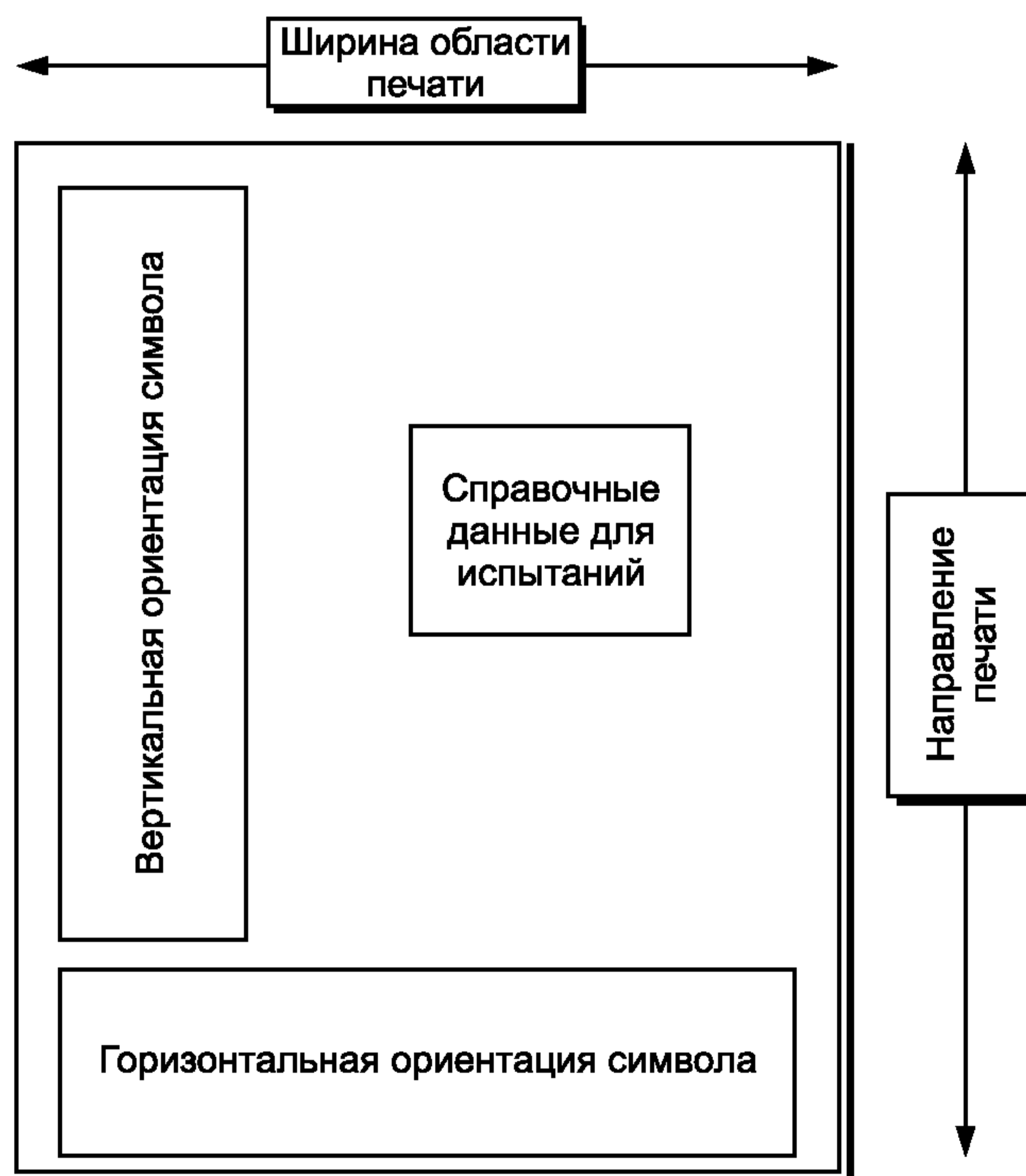
Рисунок А.1 — Образец тестового макета

Макет, изображенный на рисунке А.1, представляет рекомендуемое расположение тестовых символов штрихового кода на тестовой этикетке. Размеры этикетки не определены, ее ширина должна соответствовать ширине области печати конкретного принтера, на котором проводят испытание, а число символов символика и относительное расположение тестовых символов может быть уточнено. Область печати должна распространяться на всю ширину макета, за исключением мест, оставленных для свободных зон до знака Start (СТАРТ) и после знака Stop (СТОП) в тестовых символах.