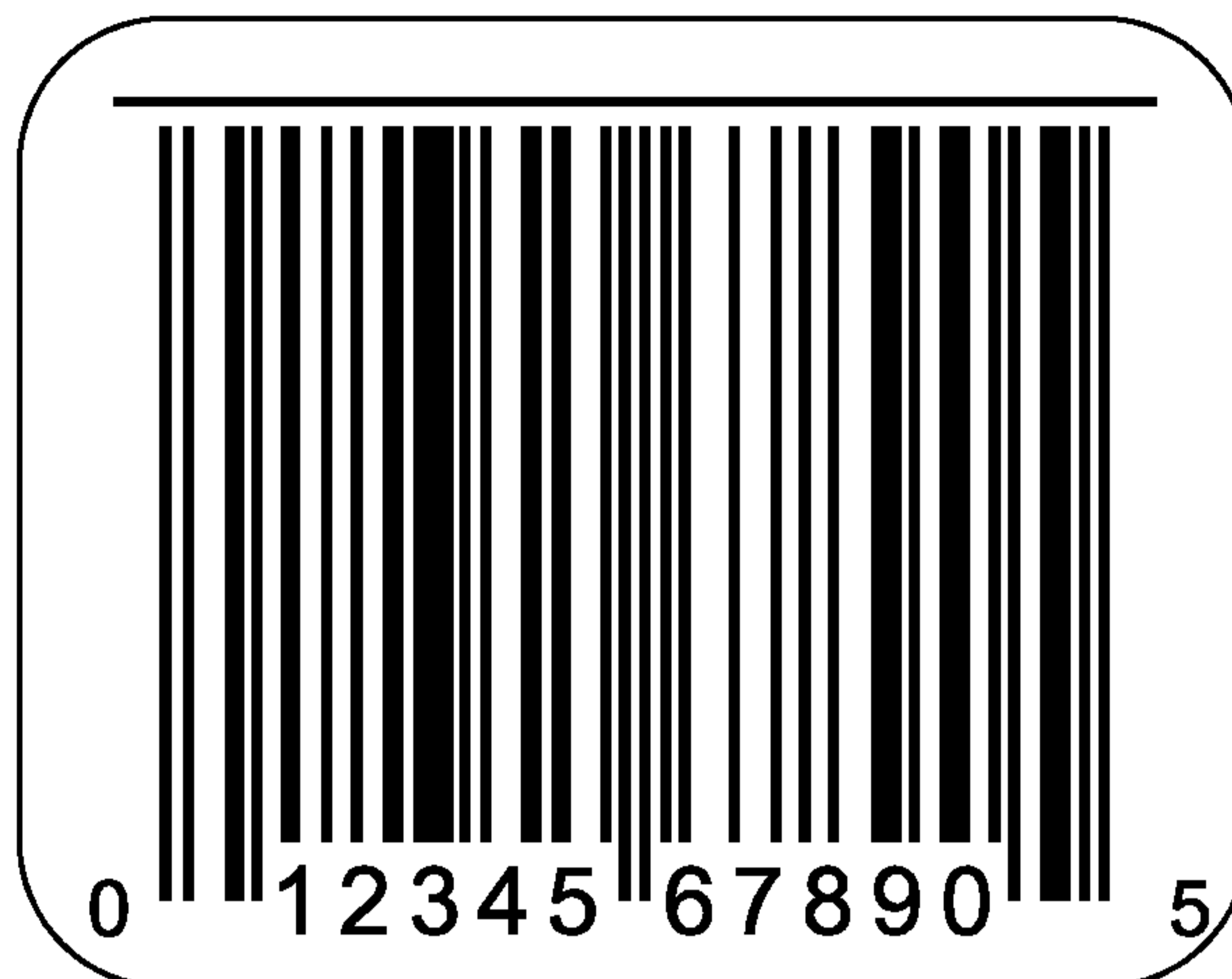
Рисунок С.1 — Линия для выявления дефектных элементов печатающей головки

по ИСО/МЭК 15416, они, тем не менее, могут быть весьма полезны для мониторинга процесса печати. Альтернативный метод обнаружения дефектных точек — печать линии вдоль символа в соответствии с рисунком С.1. Любой точечный дефект, который будет выглядеть как маленький разрыв линии, будет замечен оператору.