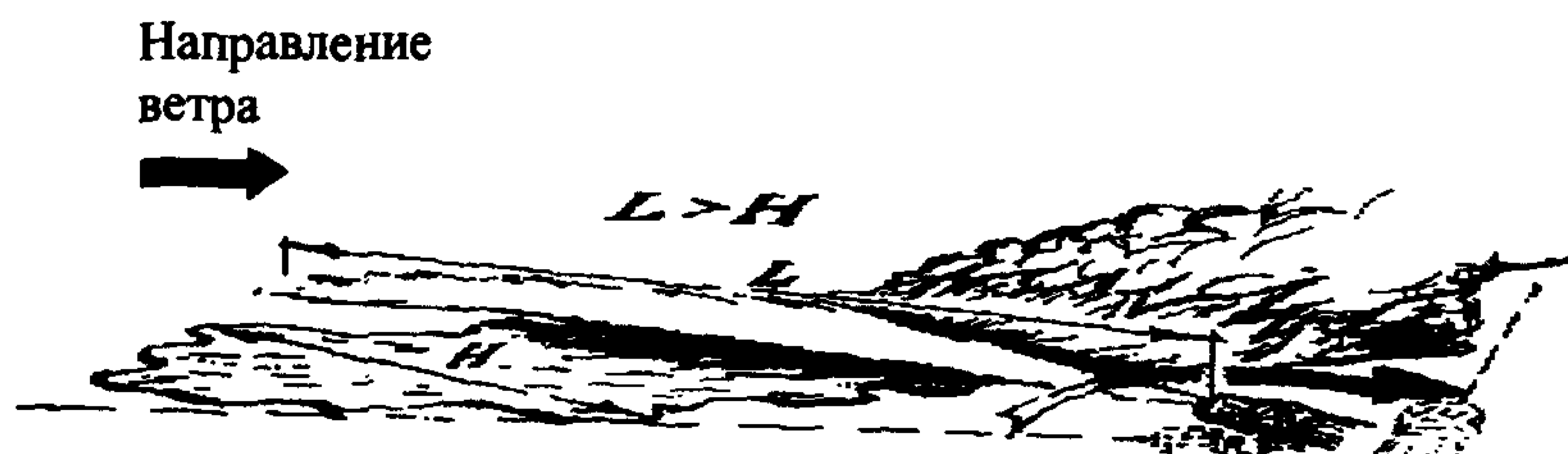
Рис. 3. Схема применения устройства для тушения проливов ЛВЖ способом “срезания” пламени

Нужно также учитывать высокую скорость подачи ОТВ. Управление стволом должно быть плавным, чтобы не разбрызгивать горючую жидкость и не допустить проскока пламени. При тушении ЛВЖ с близких расстояний в первый момент подачи ОТВ нужно быть готовым к импульсивному выбросу тепла из очага горения.