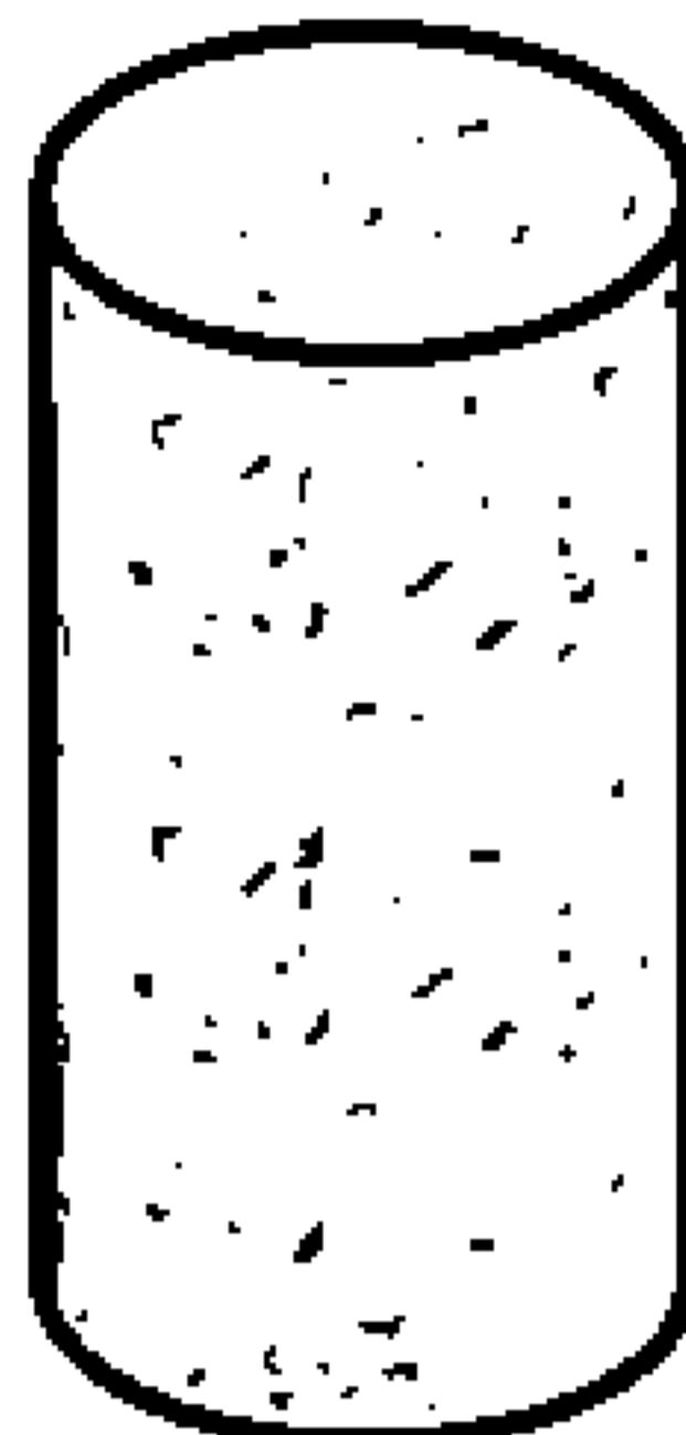
Рисунок 2 — Агломерированная корковая пробка

4.1.2 Агломерированные корковые пробки — это пробки, корпус которых целиком состоит из агломерата (рисунок 2). Пробки этого типа не следует использовать для игристых вин.