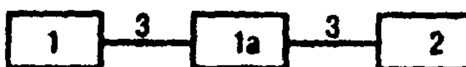
Рисунок 3 – Структурная схема ИИС

1 – измерительная диафрагма; 1а – первичный измерительный преобразователь расхода; 2 – тепловычислитель; 3 – линия связи