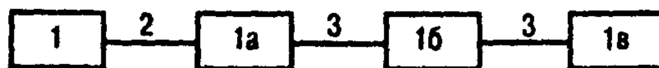
Рисунок 1 – Структурная схема измерительной системы с регистрирующими приборами с дифференциально-трансформаторной схемой связи

1 – измерительная диафрагма; 1а – первичный измерительный преобразователь расхода; 1б – блок извлечения корня; 1в – вторичный измерительный регистрирующий прибор расхода; 2 – трубные проводки; 3 – линии связи