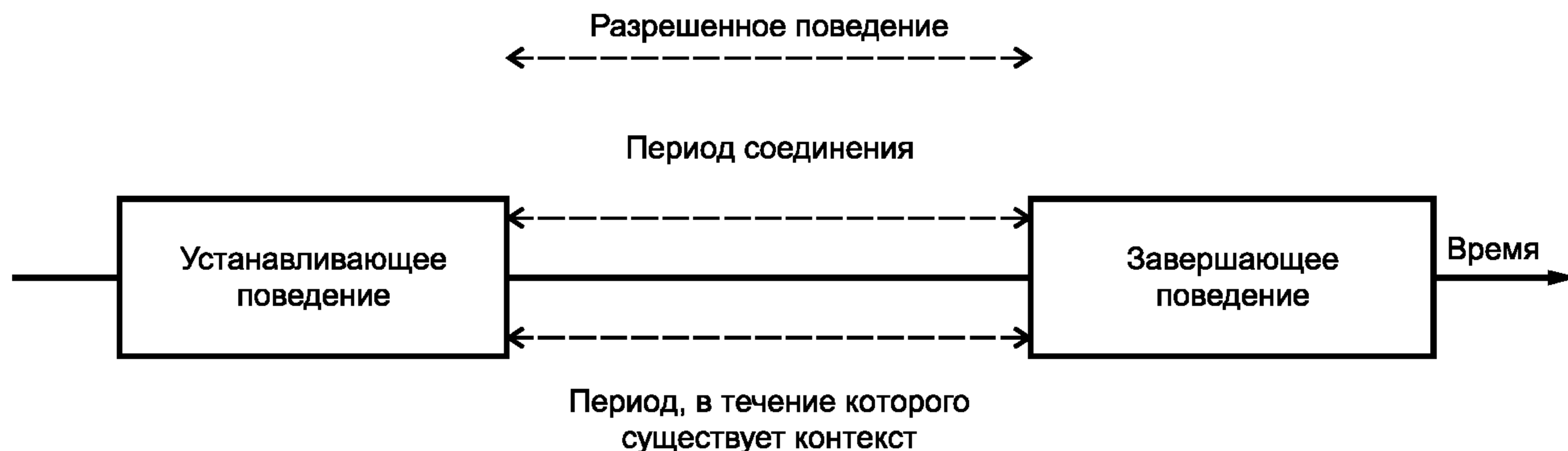
Рисунок 2 — Соединение и связанные понятия

а) явным, получающимся из взаимодействий объектов, которые будут частью контракта, или