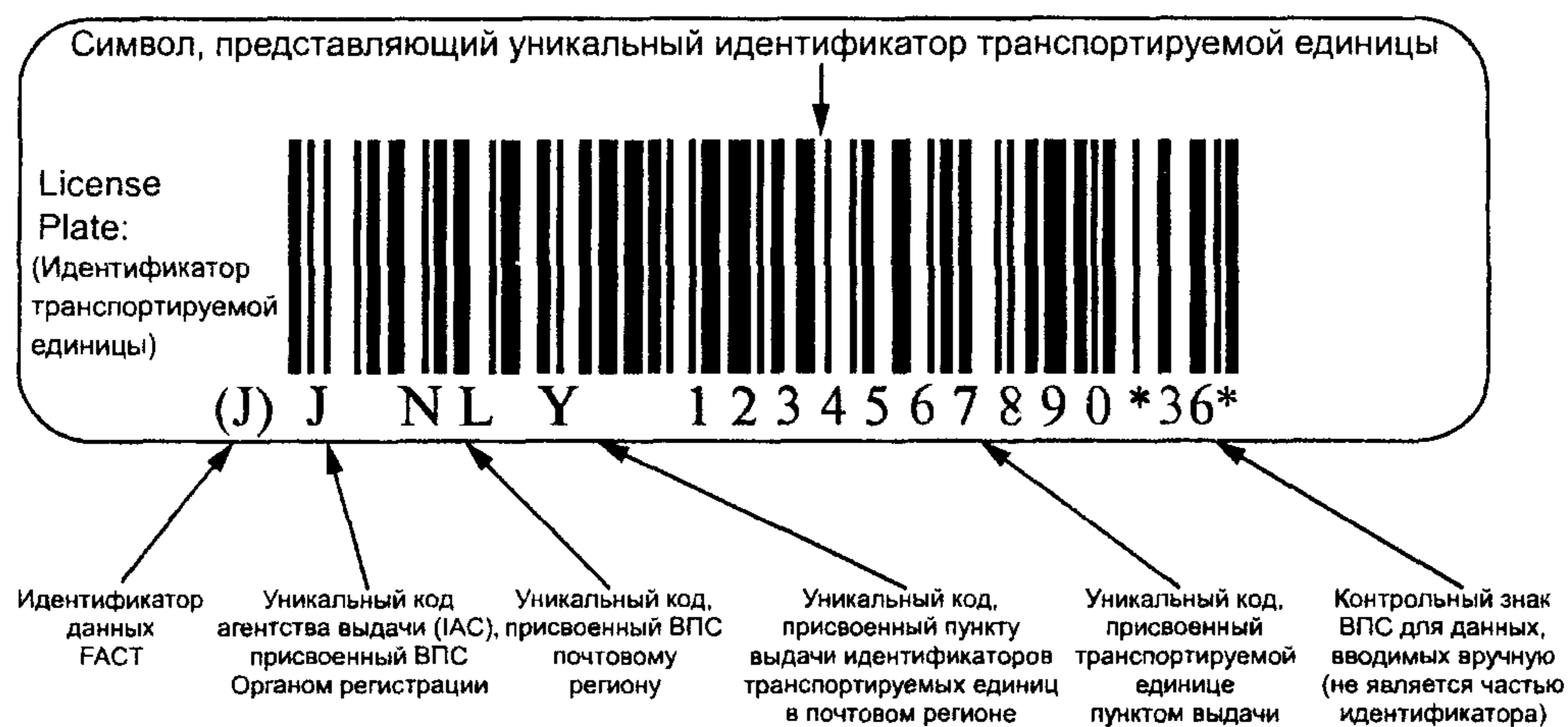
Рисунок В.2 — Пример представления уникальной идентификации транспортируемых единиц в символике штрихового кода Code 128 (Код 128)

В.2 Пример представления уникальной идентификации транспортируемых единиц в символике штрихового кода Code 128 (Код 128)** с идентификатором данных ФАКТ (ФАКТ)*** «J» и визуальным представлением приведен на рисунке В.2.