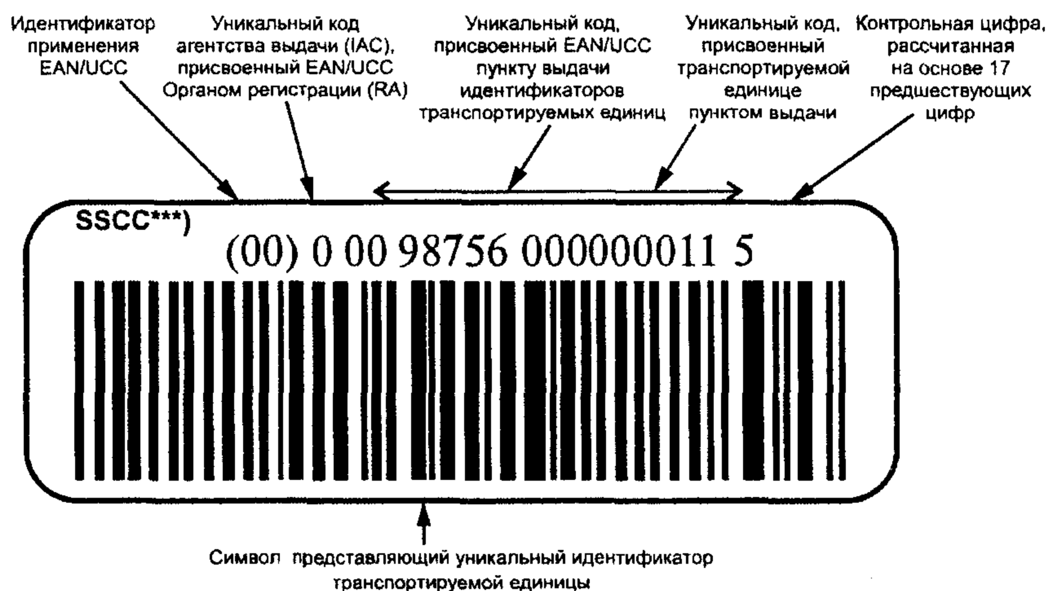
Рисунок В.1 — Пример представления уникальной идентификации транспортируемых единиц в символике штрихового кода EAN/UCC 128 с идентификатором применения EAN/UCC «00» и визуальным представлением

В.1 Пример представления уникальной идентификации транспортируемых единиц в символике штрихового кода EAN/UCC 128* с идентификатором применения EAN/UCC** «00» и визуальным представлением приведен на рисунке В.1.