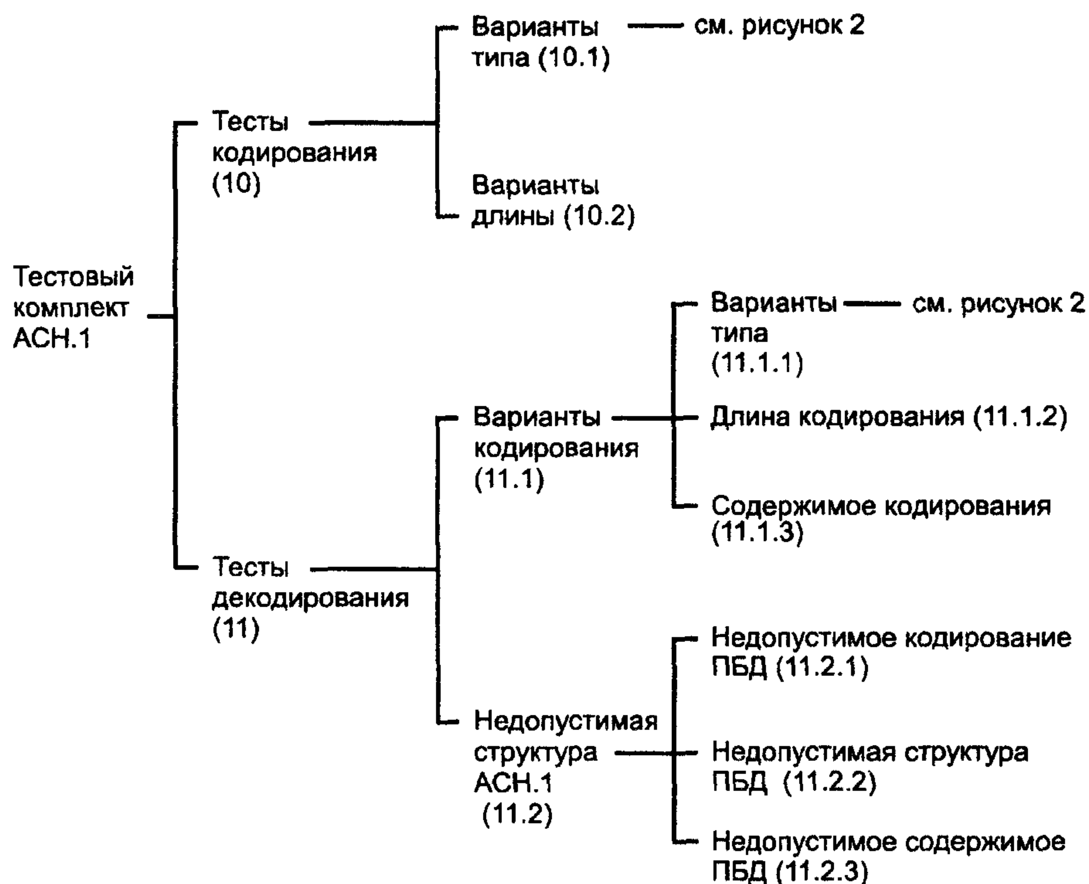
Рисунок 1 — Структура тестового комплекта АСН.1

Каждая из этих групп подразделена на ряд тестовых групп более низкого уровня. Полная структура большинства тестовых групп дана на рисунках 1 и 2.