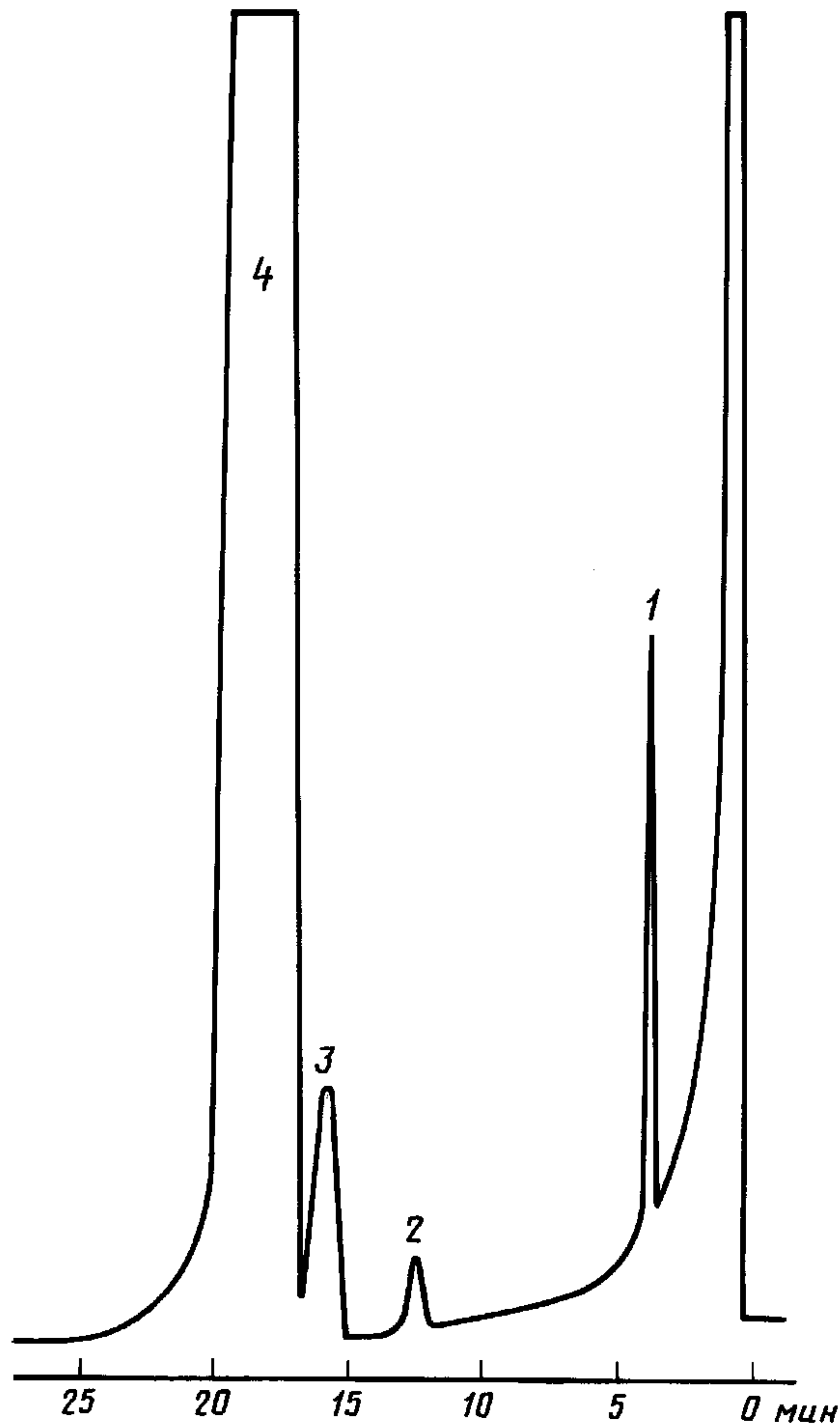
1 — 1,2-дихлорбензол; 2 — 2-нитротолуол; 3 — 3-нитротолуол; 4 — 4-нитротолуол

Порядок выхода компонентов из колонки приведен на хроматограммах (черт. 1 и 2).