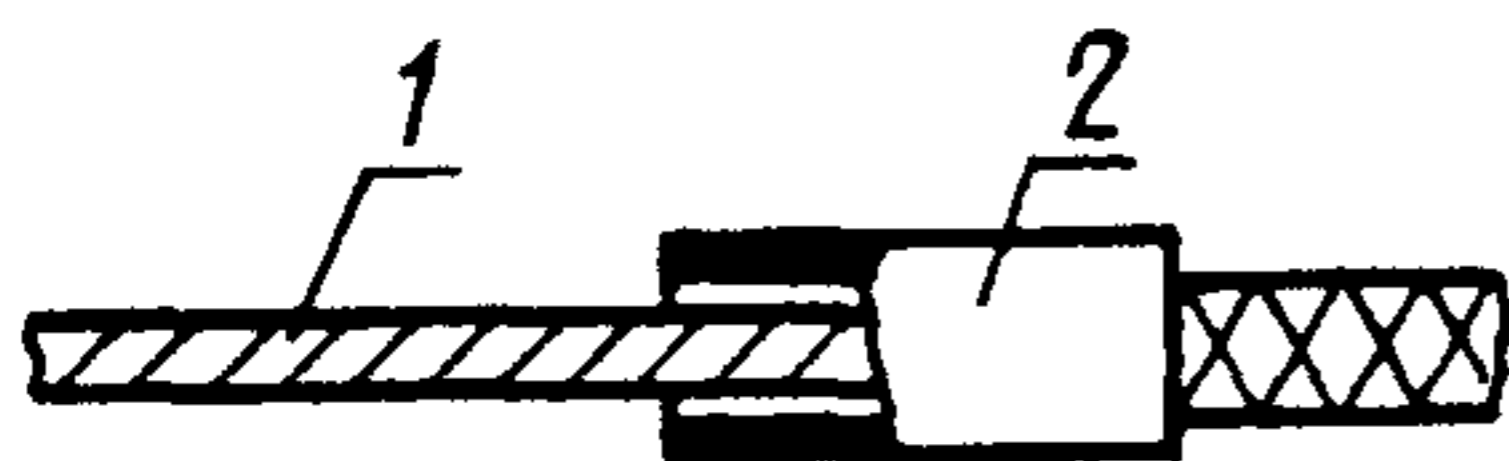
1 — провод; 2 — бирка (лента)

1.2.6. Для маркирования проводов диаметром по изоляции до 1 мм следует применять цветные маркировочные трубки с внутренним диаметром, соответствующим наружному диаметру провода (без приклейки клеем).