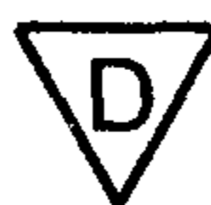
Рисунок 1 — Символ светильника с ограничением температуры поверхности

Светильники должны быть маркированы символом, приведенным на рисунке 1. Эта маркировка должна быть видна и соответствовать требованиям 3.2с МЭК 60598-1.