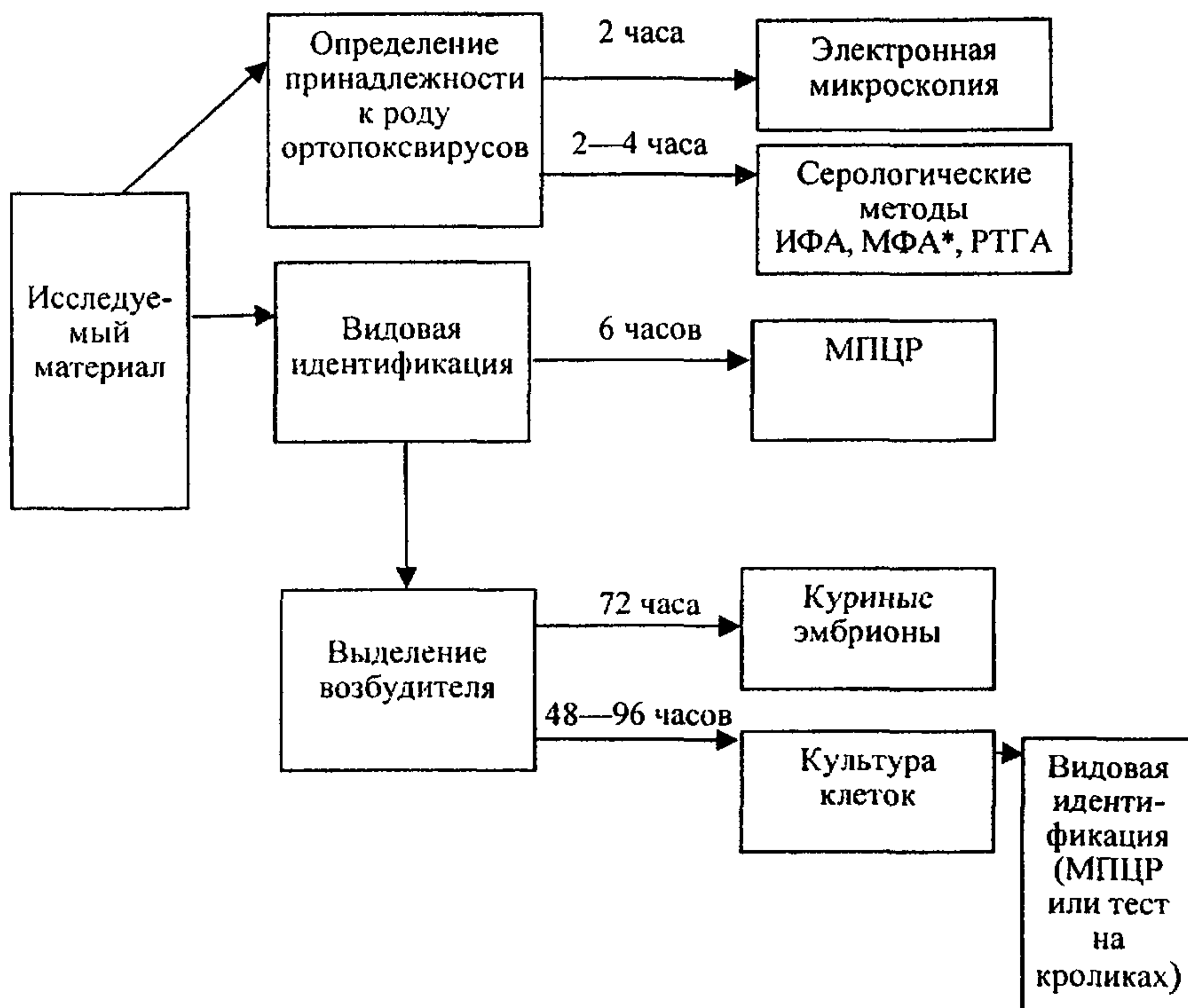
Схема лабораторного исследования с помощью основных методов диагностики

*Выявление ортопоксвируса непосредственно в материале от больного в ранние стадии болезни (до появления пустул)