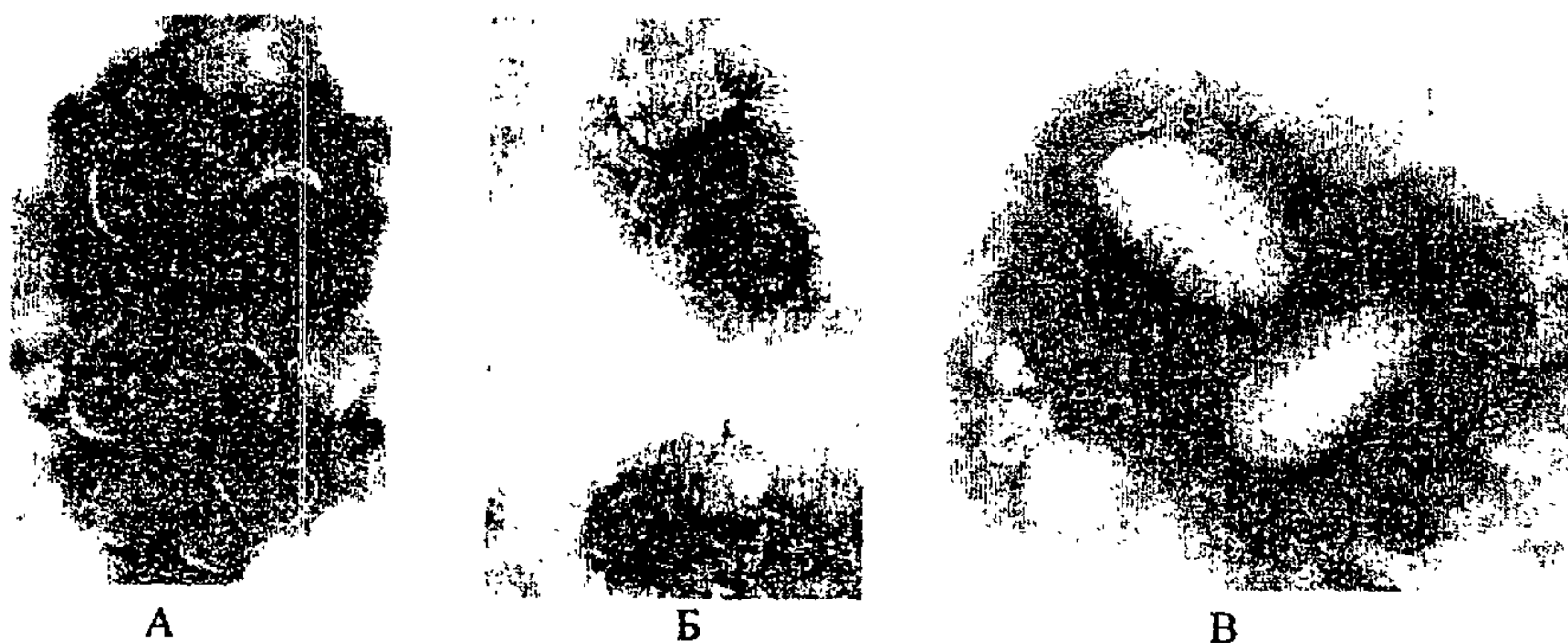
Рис. 2. Вирионы вируса ветряной оспы (А и Б) и вирионы парапоксвируса (В) А — вирус ветряной оспы с наружной оболочкой-конвертом при увеличении 100 000; Б — тот же вирус без наружной оболочки при увеличении 168 000; В — вирионы парапоксвирусов (паравакцины)

Заключение о результатах исследования основывается на данных просмотра не менее 2 сеток от больного. Обнаружение 3 и более вирионов с характерной для ортопоксвирусов морфологией считается достаточным для заключения о наличии в материале ортопоксвирусов. Для отрицательного заключения в каждой из двух сеток просматривают не менее \frac{3}{4} ячеек в течение 30 мин.