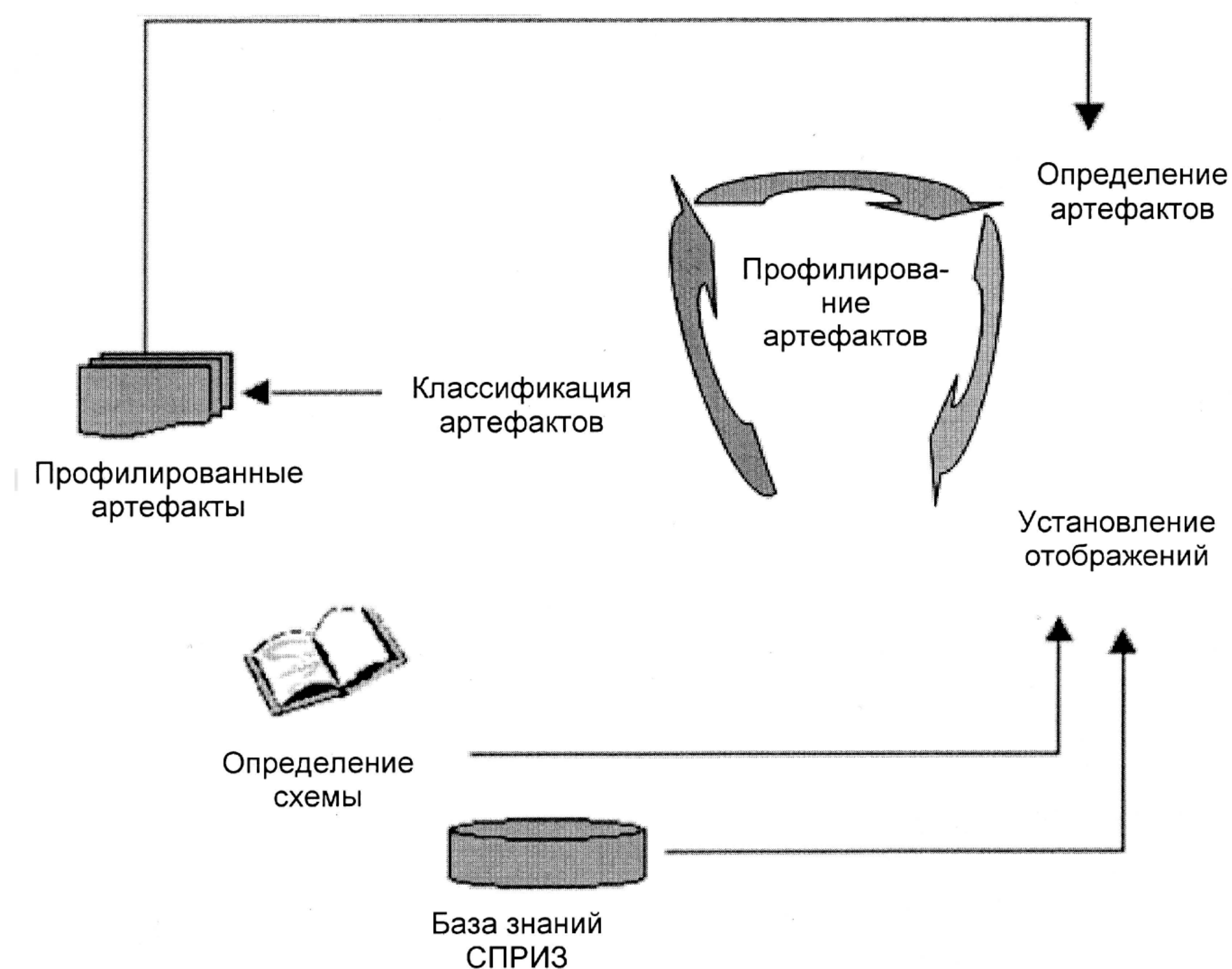
Рисунок 2 — Профилирование артефактов

Данный многоступенчатый процесс является итеративным. Определение артефакта может изменяться с течением времени по мере получения новых знаний об артефакте и внесения изменений в определение СПРИЗ.