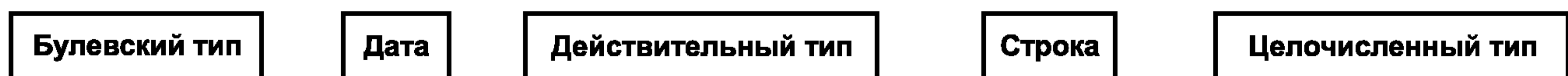
Рисунок А.1 — Простые типы данных

Соответствующие диаграммы представлены на рисунках А.1, А.2, А.3.