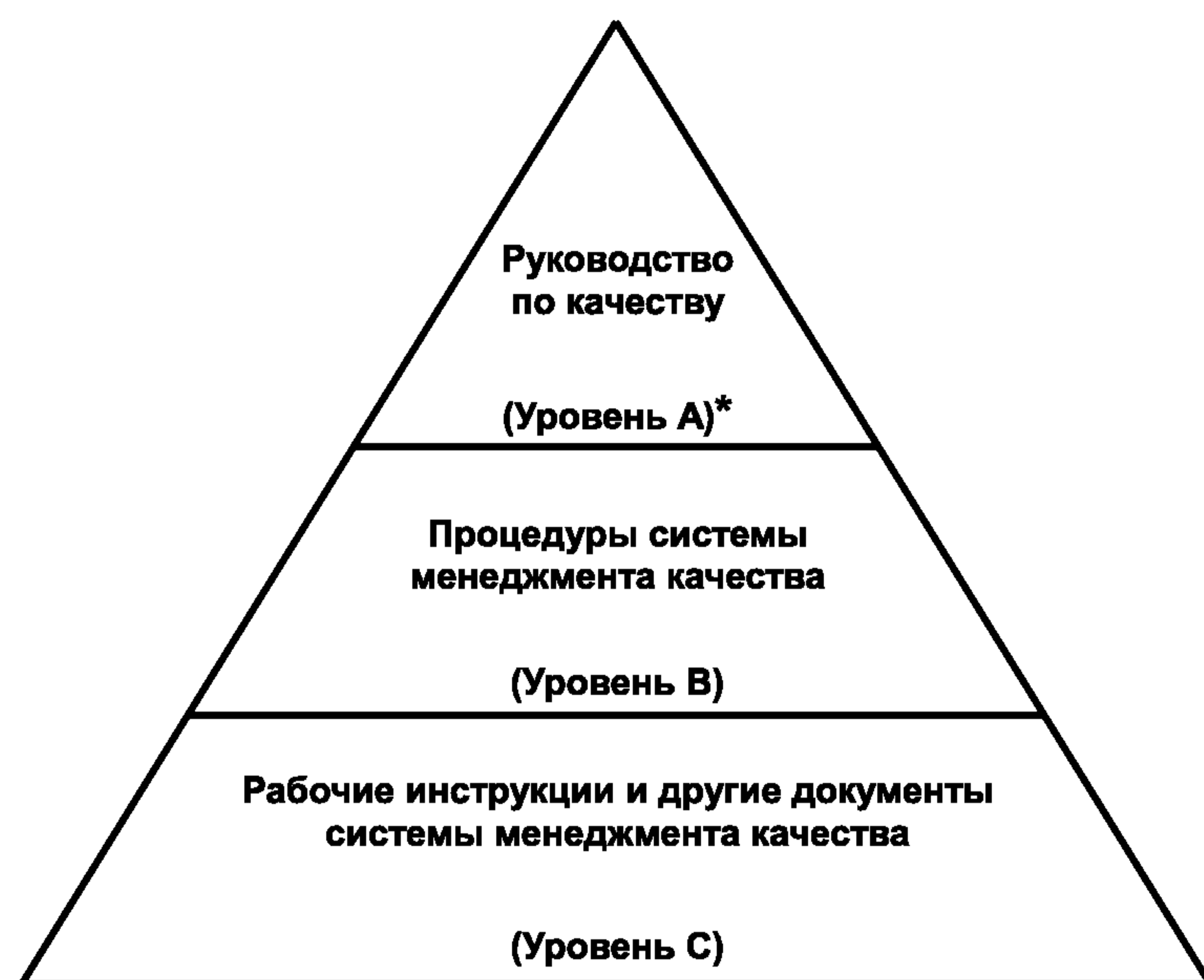
Рисунок 1 — Типовая структура документации системы менеджмента качества

Уровень «А» описывает систему менеджмента качества в соответствии с заявленными политикой и целями в области качества (см. 4.3 и 4.4).