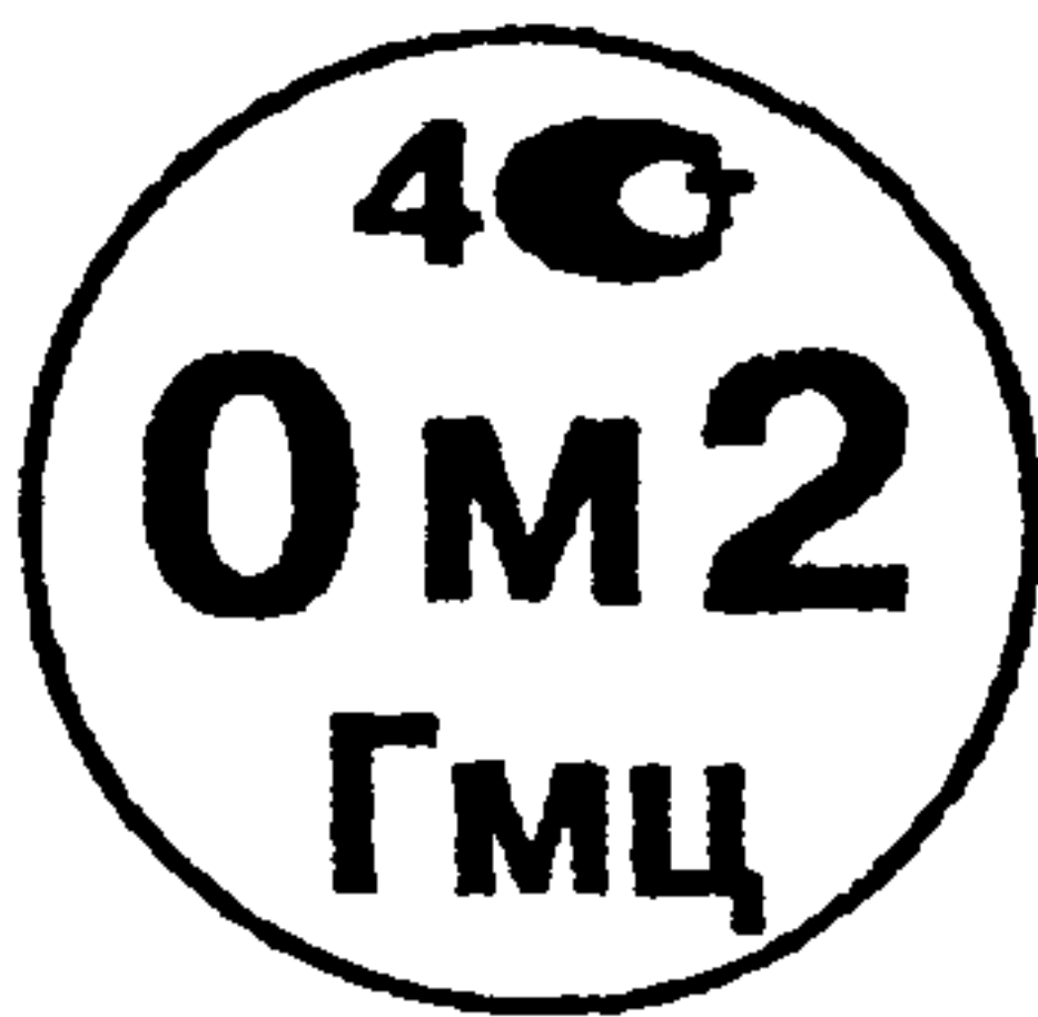
Рисунок А.1 – Поверительное клеймо ГМЦ