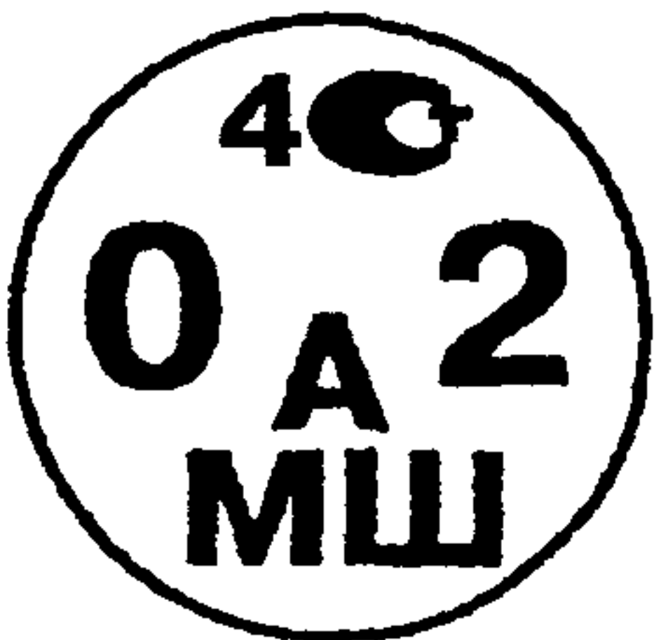
Рисунок А.1 – Поверительное клеймо ЦСМ