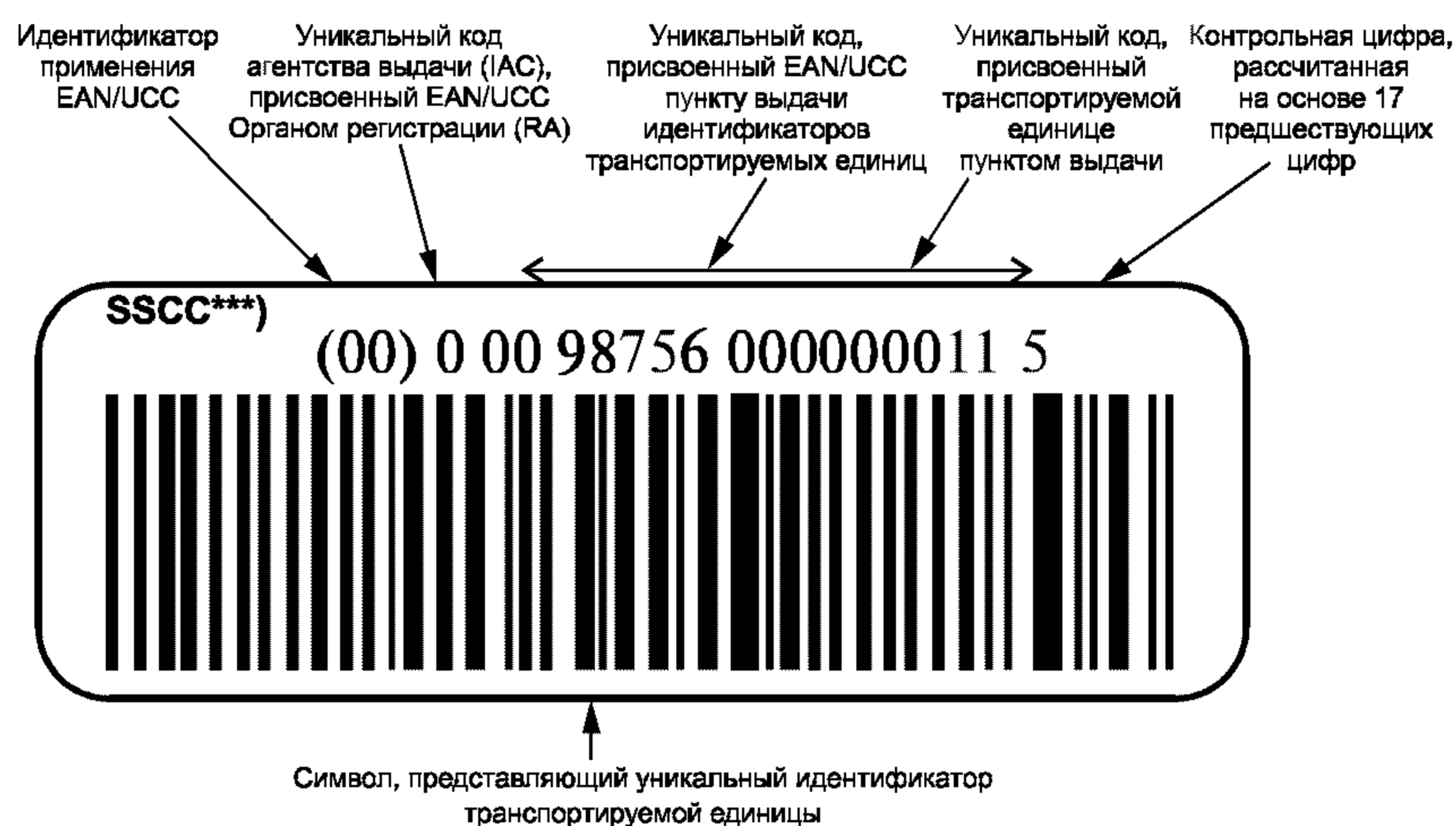
Рисунок В.1 — Пример представления уникальной идентификации транспортируемых единиц в символике штрихового кода EAN/UCC 128 с идентификатором применения EAN/UCC «00» и визуальным представлением знаков

В.1 Пример представления уникальной идентификации транспортируемых единиц в символике штрихового кода EAN/UCC 128* с идентификатором применения EAN/UCC** «00» и визуальным представлением знаков приведен на рисунке В.1.