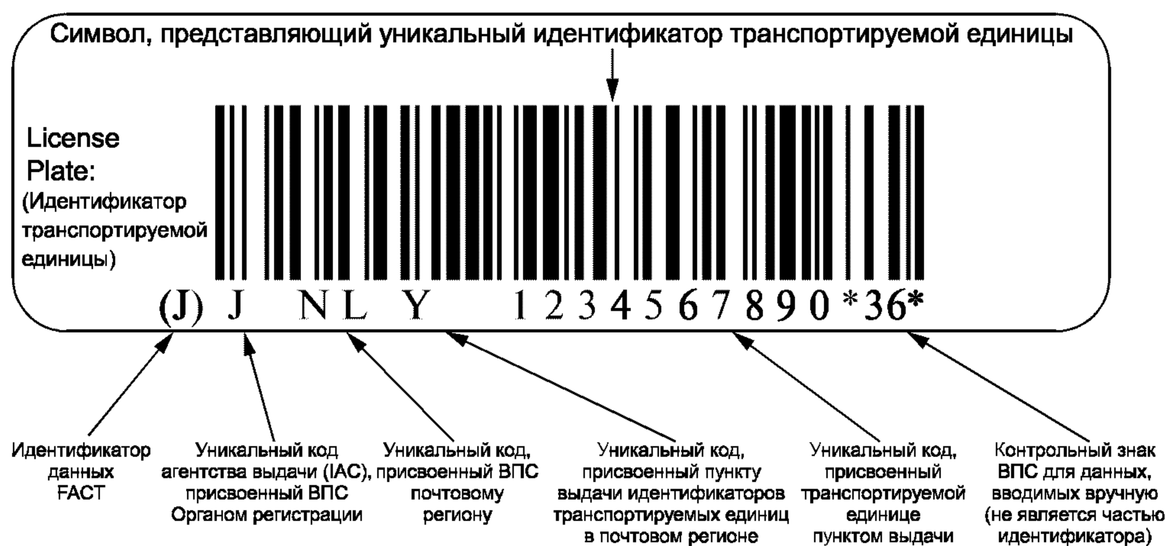
Рисунок В.2 — Пример представления уникальной идентификации транспортируемых единиц в символике штрихового кода Code 128 (Код 128)

В.2 Пример представления уникальной идентификации транспортируемых единиц в символике штрихового кода Code 128 (Код 128)** с идентификатором данных FАCT (ФАКТ)*** «J» и визуальным представлением приведен на рисунке В.2.