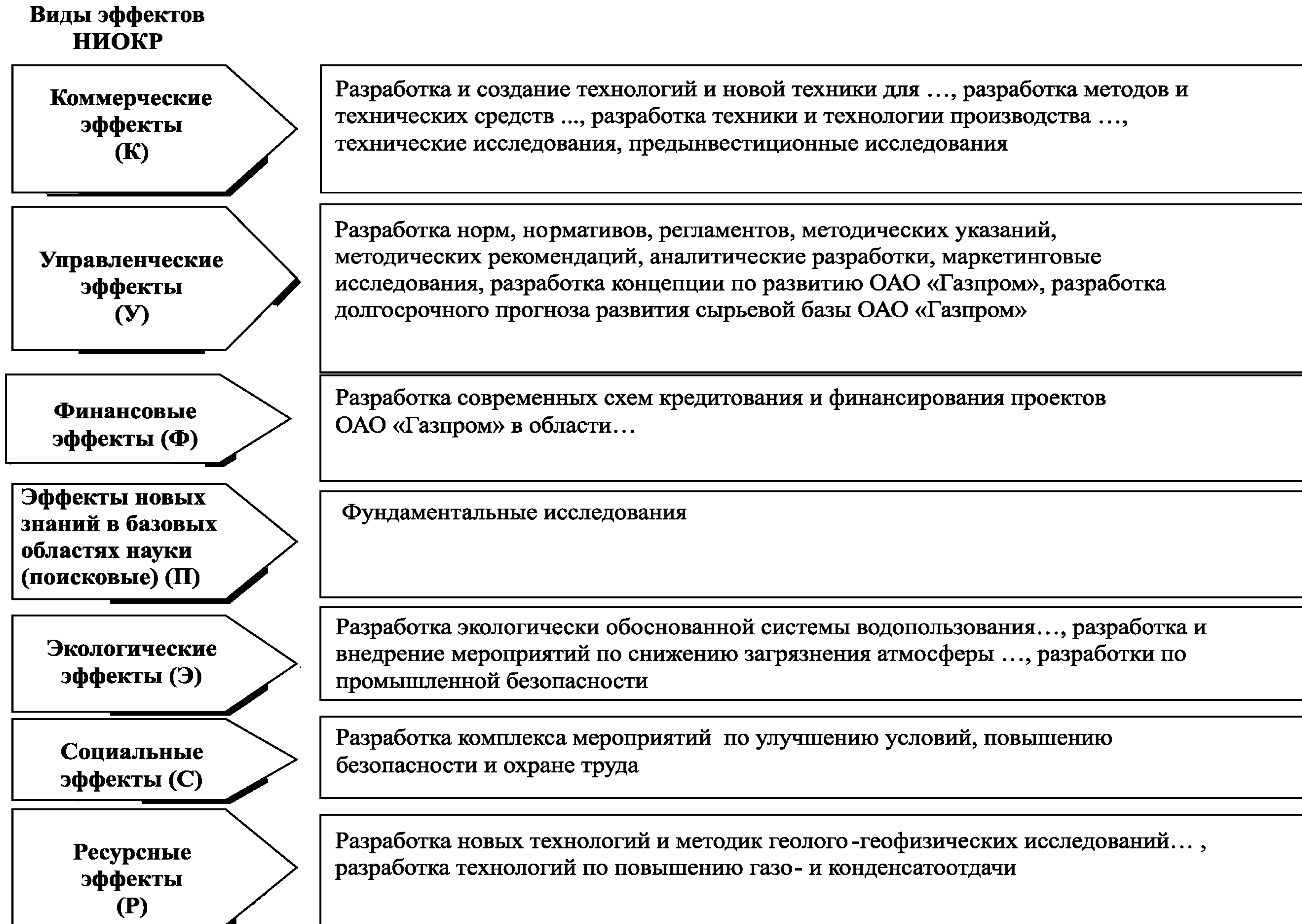
Рис. 2. Примеры НИОКР по классификационным группам