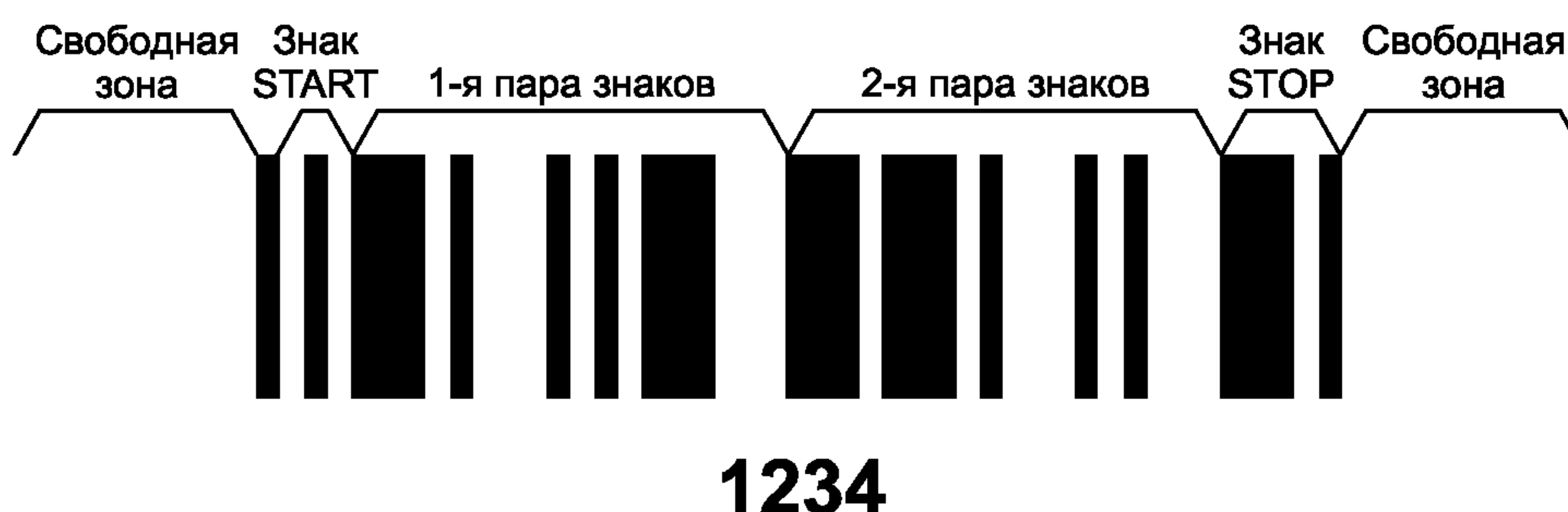
Рисунок 3 — Символ Interleaved 2 of 5, включая свободные зоны

Полный символ штрихового кода для числа 1234 с указанием свободных зон представлен на рисунке 3.