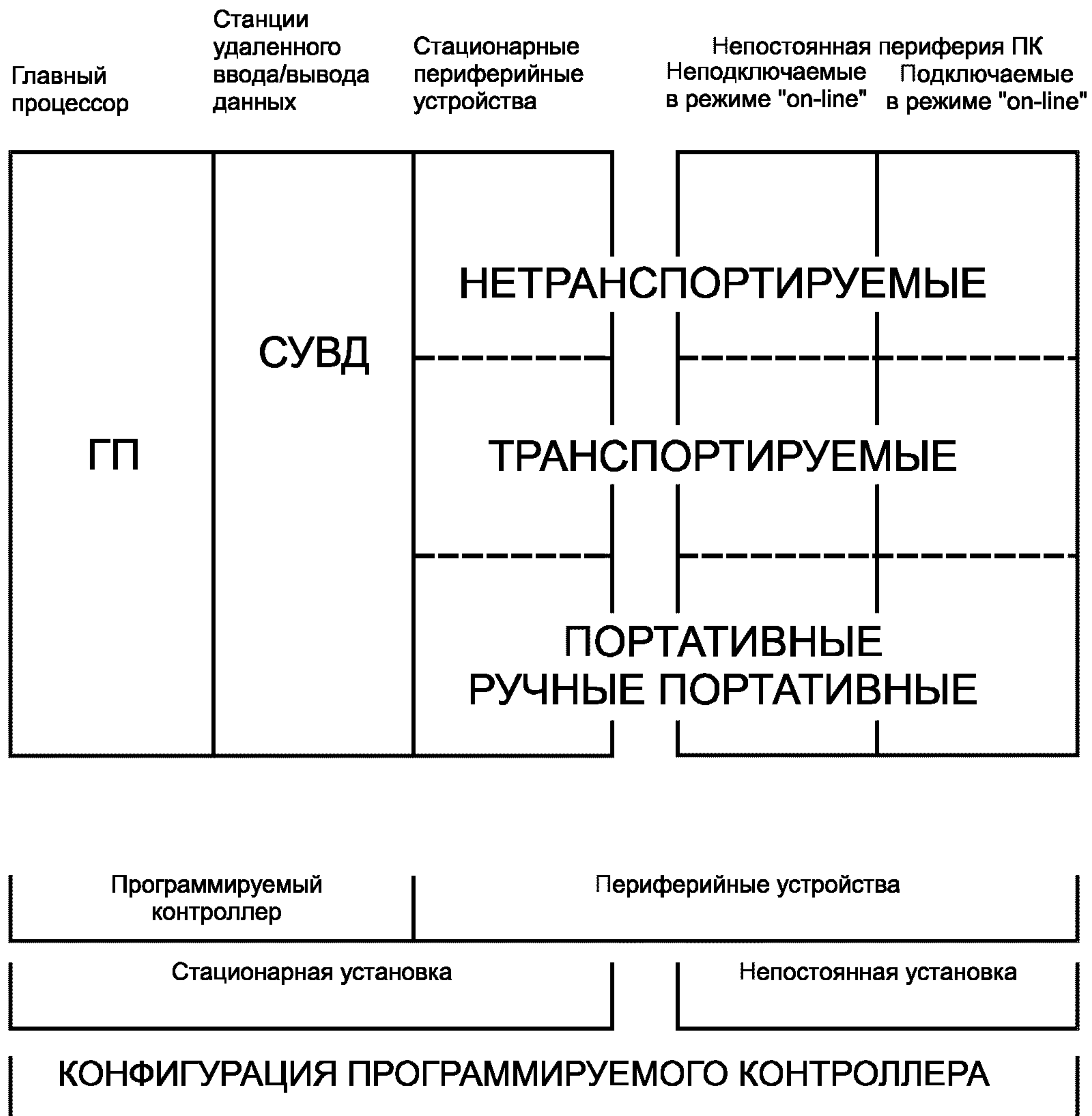
Рисунок А.1 — Конфигурация программируемого контроллера

На рисунке А.1 показана связь между определениями, относящимися к техническим средствам программируемых контроллеров.