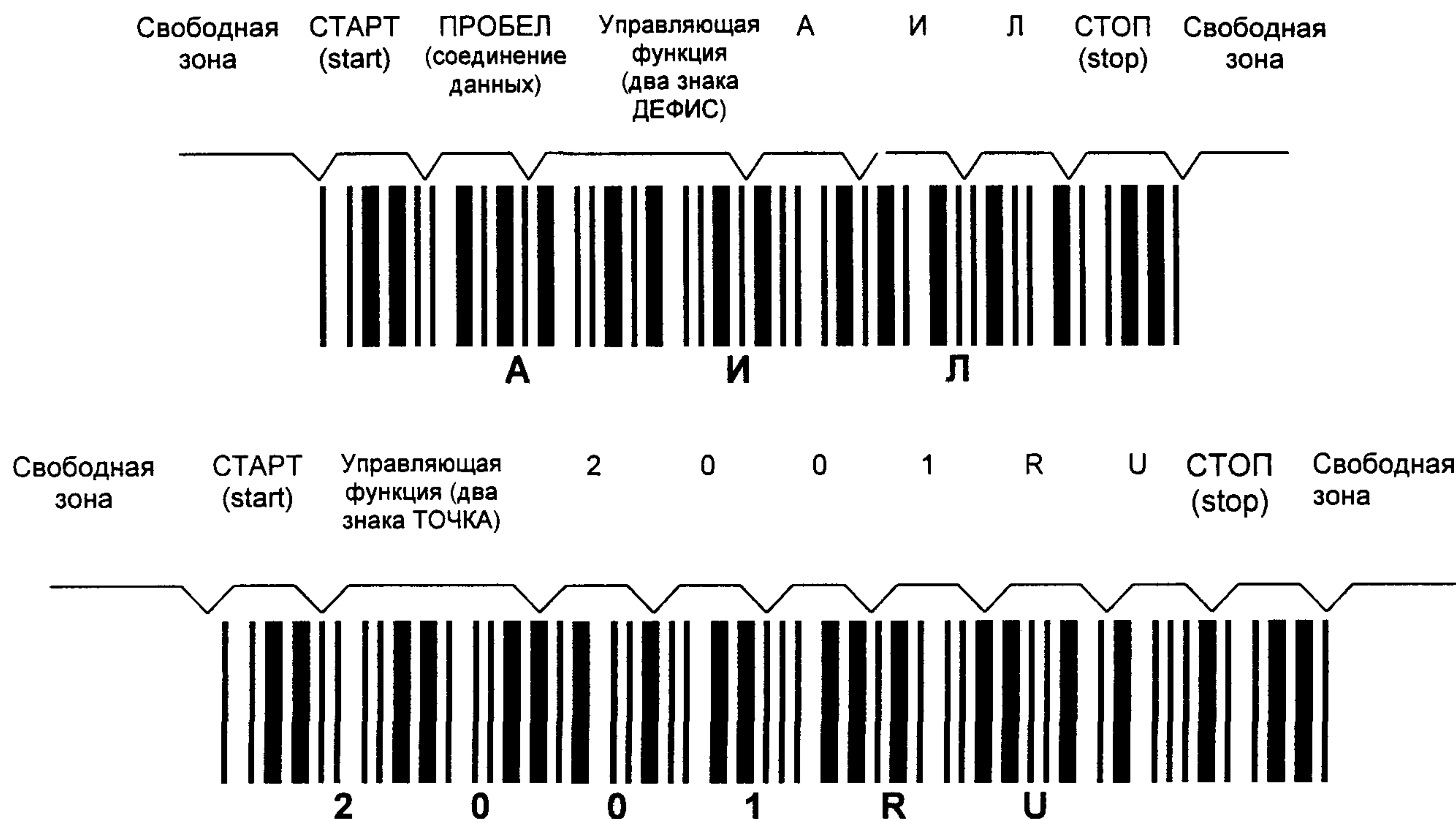
Рисунок Е.2 — Символы штрихового кода, в которых закодированы данные АИЛ2001RU