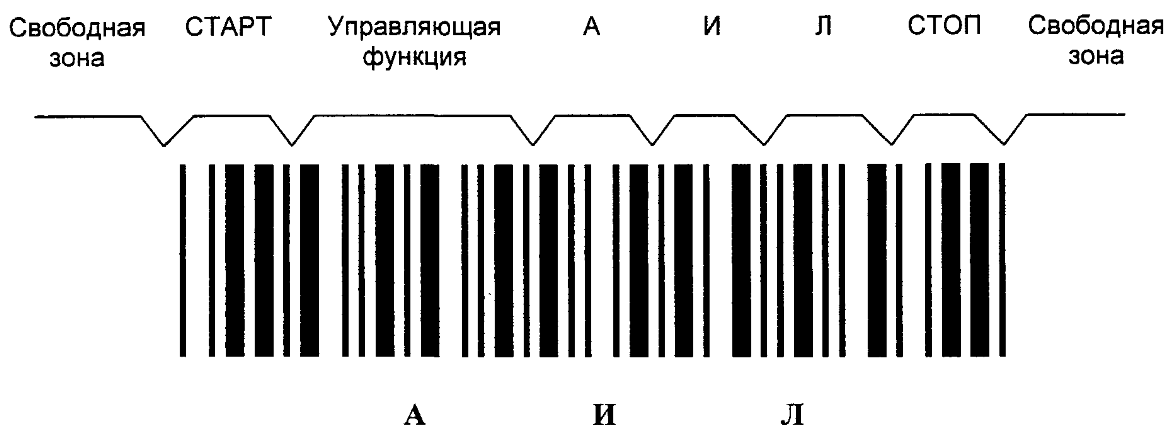
Рисунок Е.1 — Символ штрихового кода, в котором закодированы знаки АИЛ

Е.7 Для обеспечения дополнительной надежности при передаче данных с буквами русского алфавита используют контрольный знак символа набора Код 39РУ.