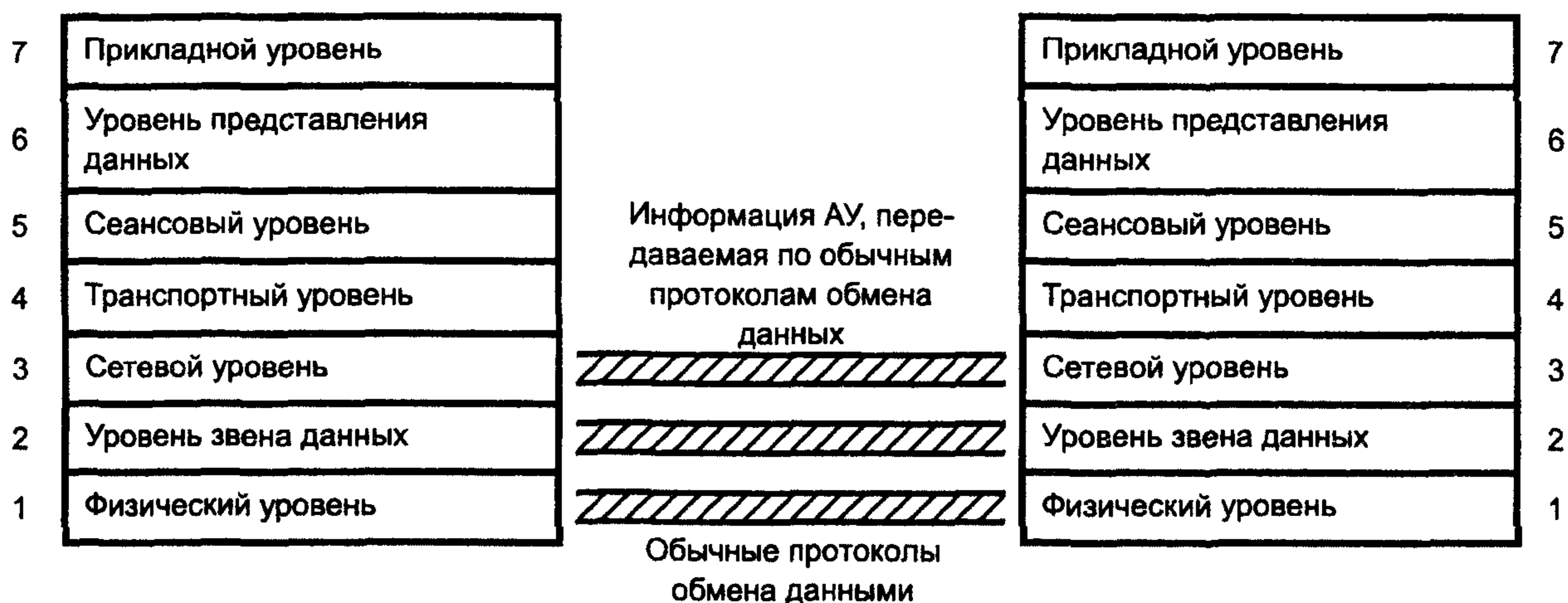
Рисунок А.3 — Операции (N)-уровня

Стандарты по операциям (N)-уровня несут ответственность за группу стандартов соответствующих уровней ВОС.